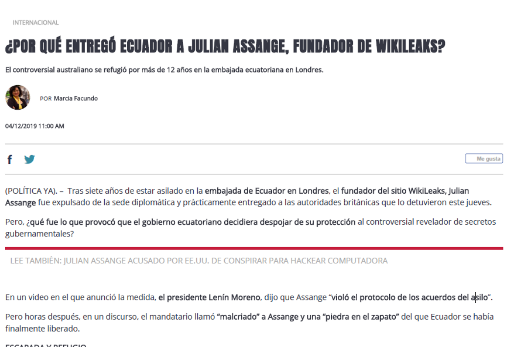
Imagen 2. Ejemplo de noticia de prensa utilizada para que los alumnos identifiquen la problemática jurídica

En este caso, el alumnado debía identificar que Julian Assange ha podido permanecer en la embajada ecuatoriana en Londres gracias a la concesión del asilo diplomático en 2012. Por este mismo motivo, la retirada de esta protección hace unas semanas ha posibilitado su detención por parte de la policía británica. El alumnado, tenía que relacionar esta forma de protección internacional con la nota de prensa expuesta, argumentando que la circunstancia en la que se ha encontrado el Sr. Assange durante estos años es posible gracias a la protección otorgada por el Estado en los locales de la misión diplomática a personas que acuden a ellos en situación de urgencia al ser perseguidas por motivos políticos o ideológicos.