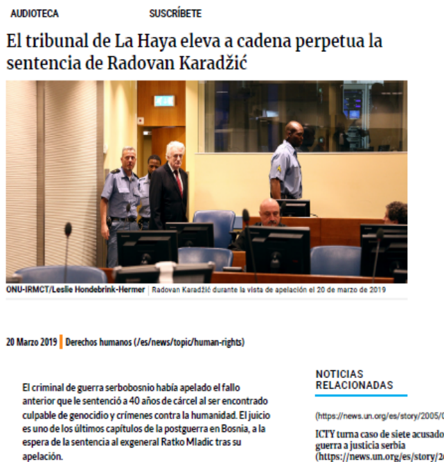
Imagen 4. Ejemplo de noticia utilizada por el alumnado para la exposición