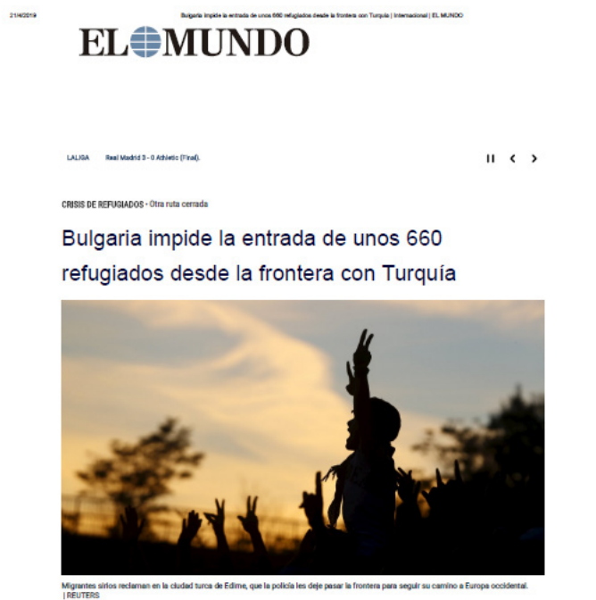
Imagen 1. Ejemplo de noticia de prensa con error conceptual presentada en el aula

En este ejemplo concreto, la mayoría del alumnado supo reconocer que, de acuerdo con el contenido de la noticia de prensa, el título de la noticia debería utilizar el término “potenciales solicitantes del estatuto de refugiado” y no la noción de “refugiados”. De acuerdo con lo estudiado en la lección 18 del programa de la asignatura, titulado “Las competencias personales del Estado”, una persona que cruza la frontera de forma irregular es, probablemente, un potencial solicitante de