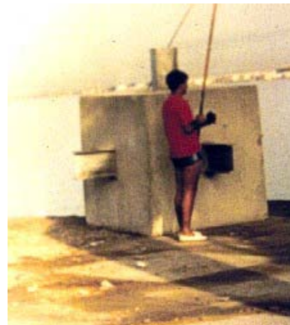
Foto 1. Bloque disuasivo del arrecife artificial de Tabarca (Alicante). Cubo macizo de 1.5 m de lado y 8.35 tm de peso.

c) Materiales y construcción : existe una amplia variedad de materiales naturales o manufacturados, de construcción diversa (prefabricados, desechos). Los arrecifes fondeados en Alicante son prefabricados de hormigón armado ( fotos 1 y 2 ).