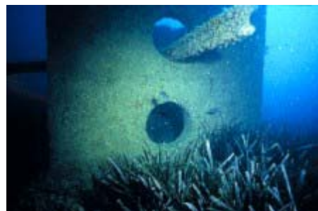
Foto 2. Bloque disuasivo del arrecife artificial de El Campello (Alicante) protegiendo la pradera de Posidonia, a -15 m de profundidad. Cubo alveolar de 2 m de lado y 7.9 tm de peso.