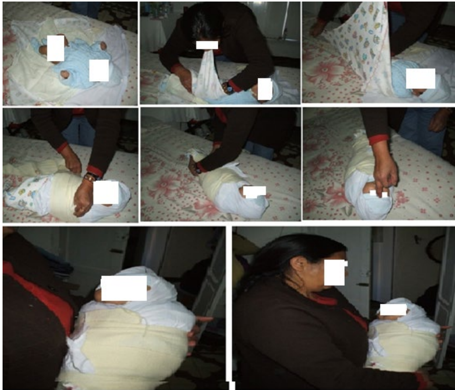
FIGURA 2: Técnica del chumpi

FUENTE: Elaboración propia. Cartagena (2009)