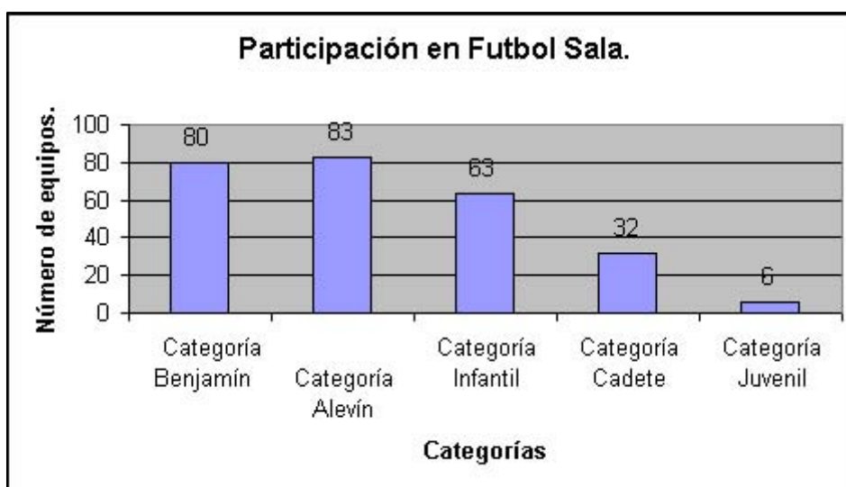
Figura nº1 Número de equipos participantes en el deporte de fútbol sala por categorías.

Los niños están influenciados en esta categoría, por un entorno que hasta el momento no le ha permitido tener experiencias competitivas suficientes por su edad madurativa, y por el escaso número de encuentros deportivos en este tipo de competición.