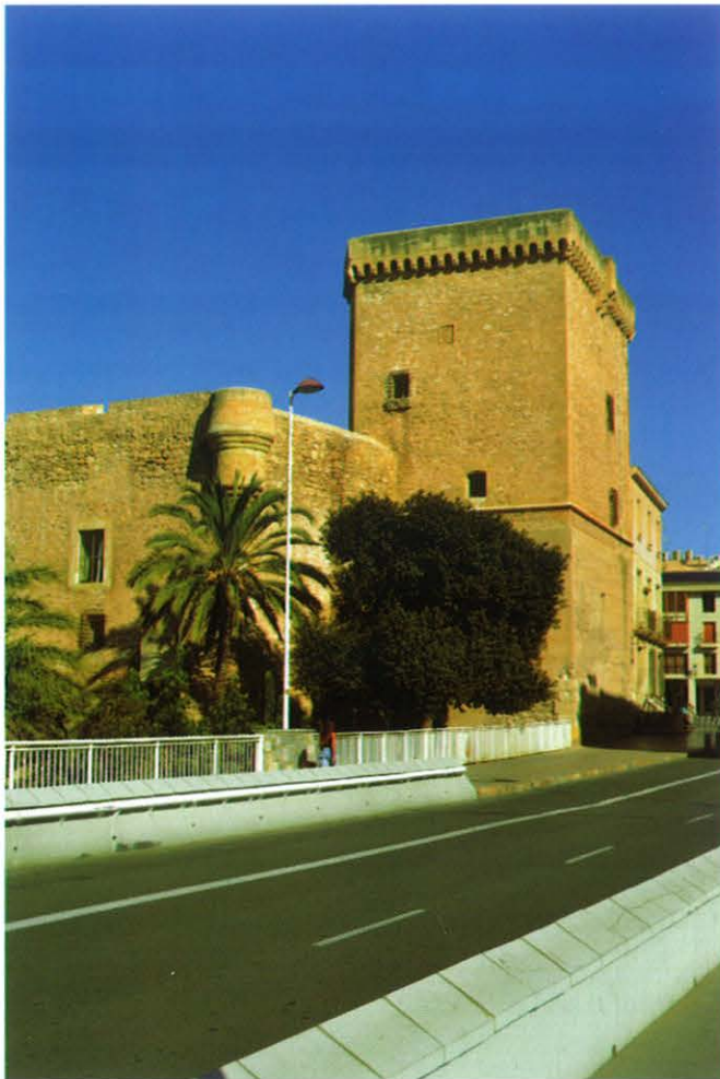
Imagen de portada: Palacio de Altamira. Alcàsser de la Senyoria