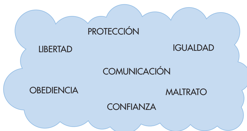
Figura I. Nube de categorías surgidas de los valores extremos

El análisis de las etiquetas de las variables que obtuvieron valores extremos en ambas muestras reveló un conjunto de categorías y conceptos que ofrecen una visión inicial de cuáles son las áreas que aparecen como destacadas por la juventud estudiada. Tal y como se recoge en la Figura I, son las siguientes: protección, libertad, igualdad, comunicación, confianza, obediencia, maltrato.