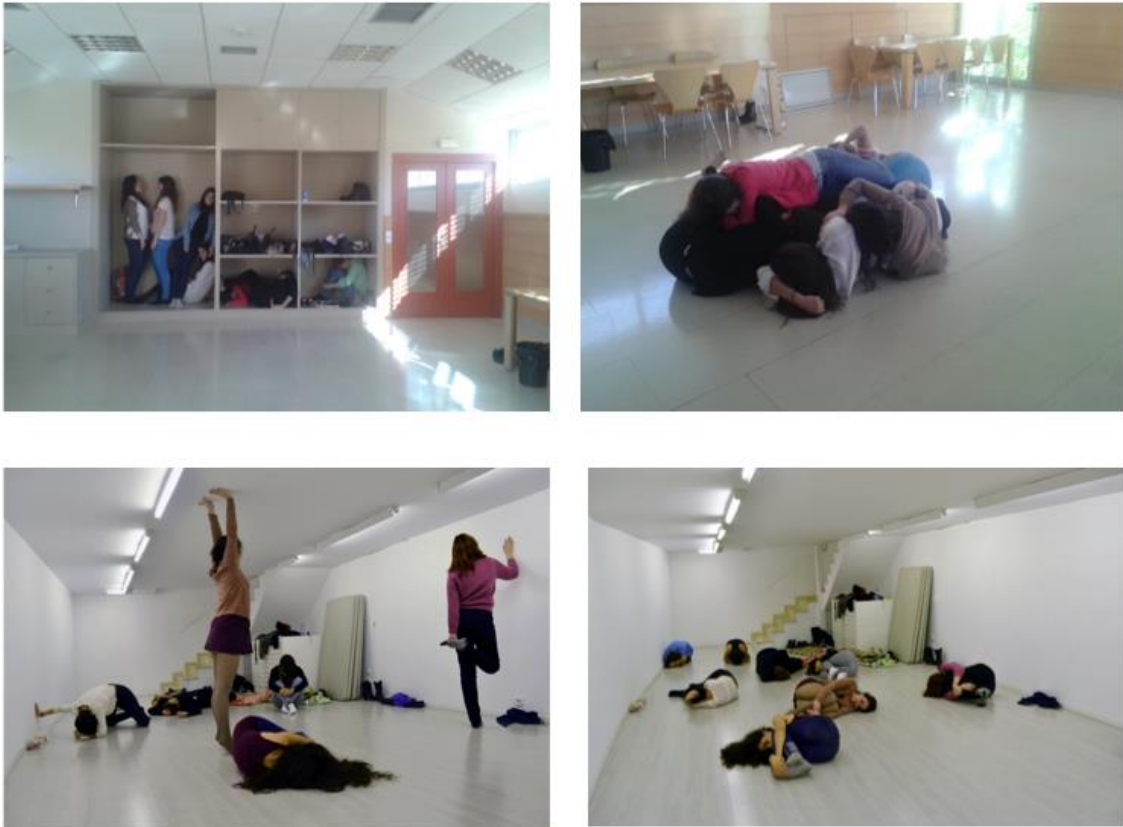
Fig. 5. Ejercicio sobre la concepción del espacio. Estudiantes en clase de Taller de Proyectos de Creación Contemporánea. Año académico 2014/2015 y 2015/2016.

Las relaciones que se generan en la clase son clave fundamental del aprendizaje porque se sienten acompañados y aprenden con gusto y sin esfuerzo, gracias a la libertad expresiva que genera la complicidad.