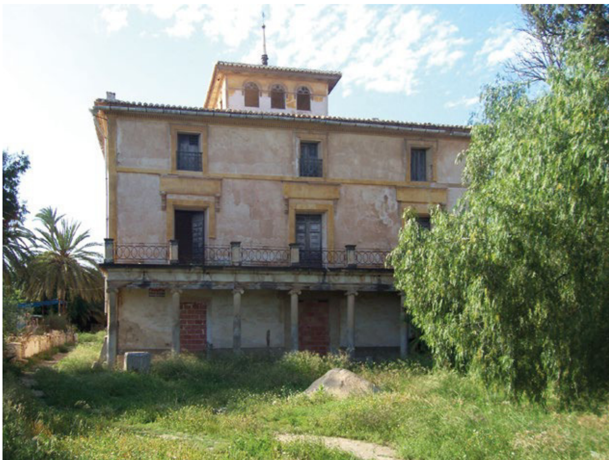
FIGURA 1. Fachada principal de la finca El de Conde o La Paz (2011).

motivos «eclecticos de raíz académica en cornisas, barandillas y recercados moldurados» (Jaén, 1999: 253), sillares almohadillados en las cantoneras de las fachadas igual que «la escalinata exterior de acceso al piso principal (...) y la puerta de entrada, que forma una exedra con volúmenes y ornamentos modernistas en hierro y piedra» (Jaén, 1999: 253) (fig. 2). Además, también está la Finca Abril en la que destacan las grandes terrazas de la planta baja con elementos clasicistas en la balaustrada y el pórtico de orden dórico en el porche oeste, mientras que en el situado al este: