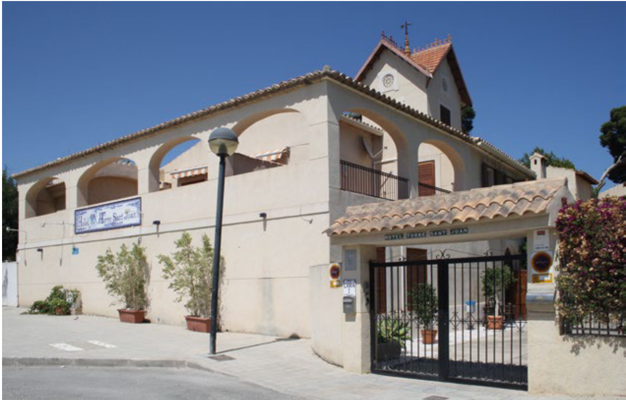
FIGURA 4. Vista general del actual Hotel Torre Sant Joan (2014) (Foto de la autora).

como objetivo convertirla en un hostel; por motivo de la crisis económica vivida, este proyecto se encuentra paralizado. Por otro lado, con un fin social encontramos Buena Vista que dio cabida a la Granja Psiquiátrica de la Diputación de Alicante, origen del Sanatorio Psiquiátrico Provincial hasta que en 2009 se acordó la constitución del Instituto de la Familia Dr. Pedro Herrero (Pérez, 2011: 9); actualmente este edificio, rehabilitado en 2011, alberga el Centro de Atención a la Familia de la Diputación de Alicante; y, La Pinada, que acoge la residencia de jubilados. Con una finalidad administrativa, destaca Pedro José, inaugurada en 2011 como Casa de la Juventud, pero se cerró con el fin de optimizar recursos y evitar sobrecostos municipales (fig. 6). En los últimos tiempos, las autoridades han barajado diferentes opciones para su uso; entre ellas, se ha propuesto la creación de un museo etnográfico para esta localidad, aunque dicha cuestión parece haber quedado en un segundo plano tras el acuerdo llegado con el Juzgado de Paz para trasladar allí sus dependencias durante octubre de 2015. Con una finalidad cultural destaca El Reloj, rehabilitado para albergar el Museo Fernando Soria, inaugurado el 31 de mayo de 2013.