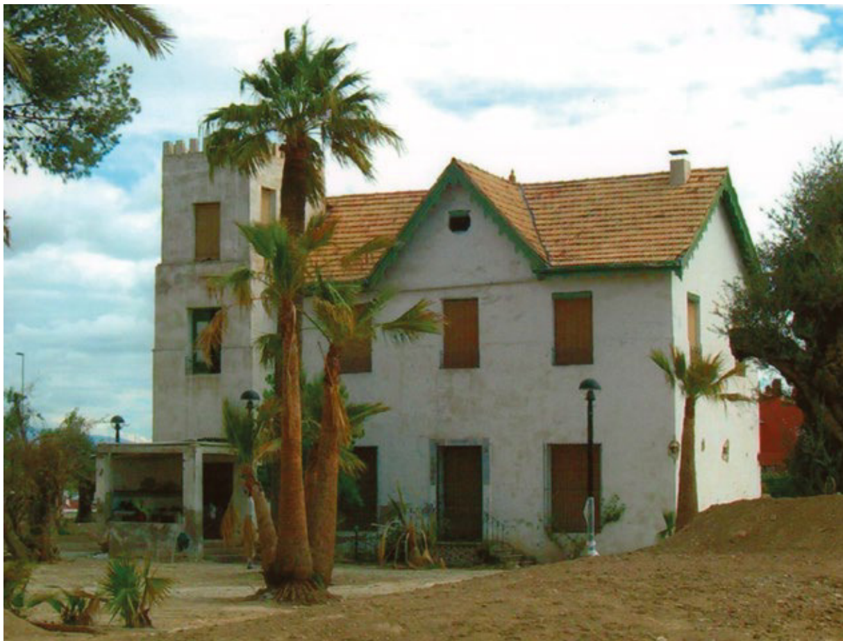
FIGURA 6. Finca de Pedro José antes de su rehabilitación (2006).