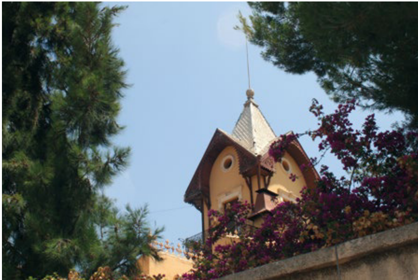
FIGURA 2. Buena Vista antes de su restauración en 2011 (Foto: Antonio Campos).