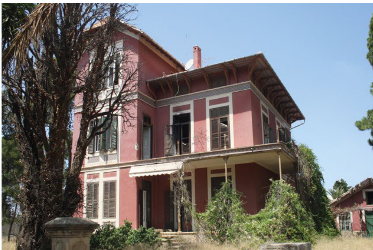
FIGURA 7. Vista general de la finca Palmeretes antes de los últimos incendios (2013).