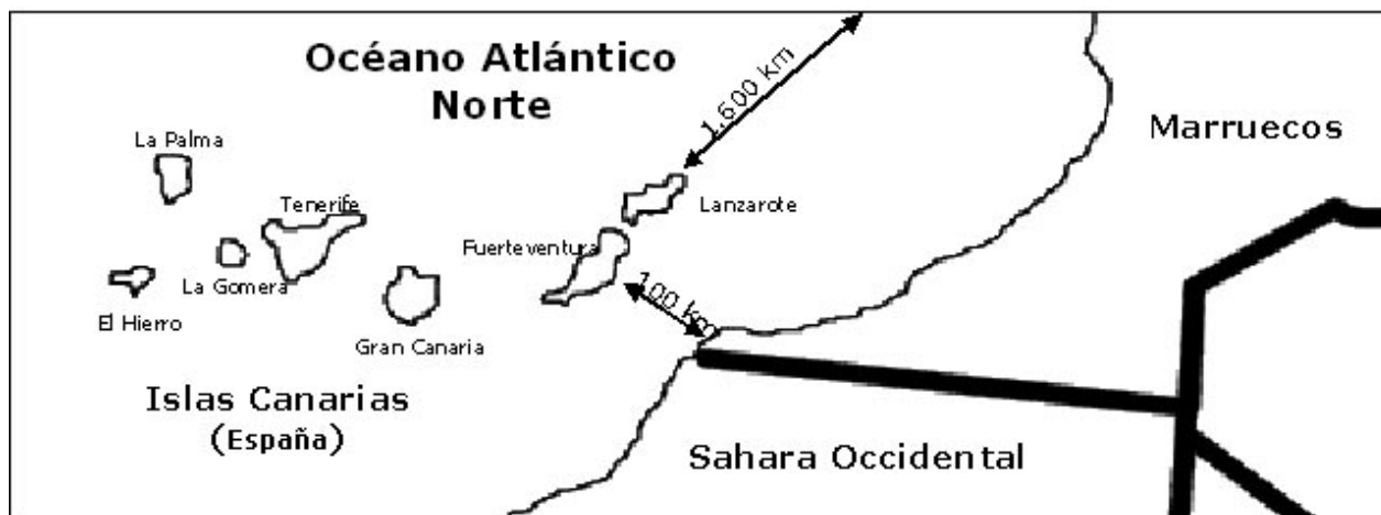
Figura 1. Situación del Archipiélago Canario en el Noroeste de la costa Africana.

En 1998 se puso en marcha una campaña por parte del Servicio Canario de Salud, cuyo fin era evaluar los factores nutricionales de la población residente en las islas de entre 6 a 75 años de edad. El estudio denominado "Encuesta Nutricional de Canarias (ENCA)", incluía entre otros aspectos la obtención de muestras de sangre de los individuos del mismo para la determinación de distintos parámetros bioquímicos. Como parte de este estudio se hicieron determinaciones de residuos de p,p' -DDT (DDT) y p,p' -DDE (DDE) existentes. Está claramente establecido que la cantidad de residuos de estos plaguicidas y sus metabolitos presentes en fluidos biológicos de una muestra representativa de la población es indicativa de la carga total corporal de dichos plaguicidas, así como del nivel de exposición pasado y presente. Está bien establecido que el cociente DDT/DDE es un buen indicador de exposiciones medioambientales al DDT y/o exposiciones ocupacionales que puedan darse actualmente por la persistencia del compuesto (Jaga y Dharmani, 2003).