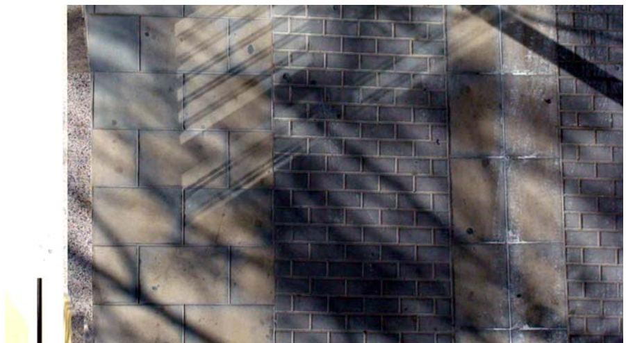
Fig.1 El encuadre del instante

El resultado de este estudio se pretende constitutivo de un filtro no de una base de datos sino de procedimientos [1] .