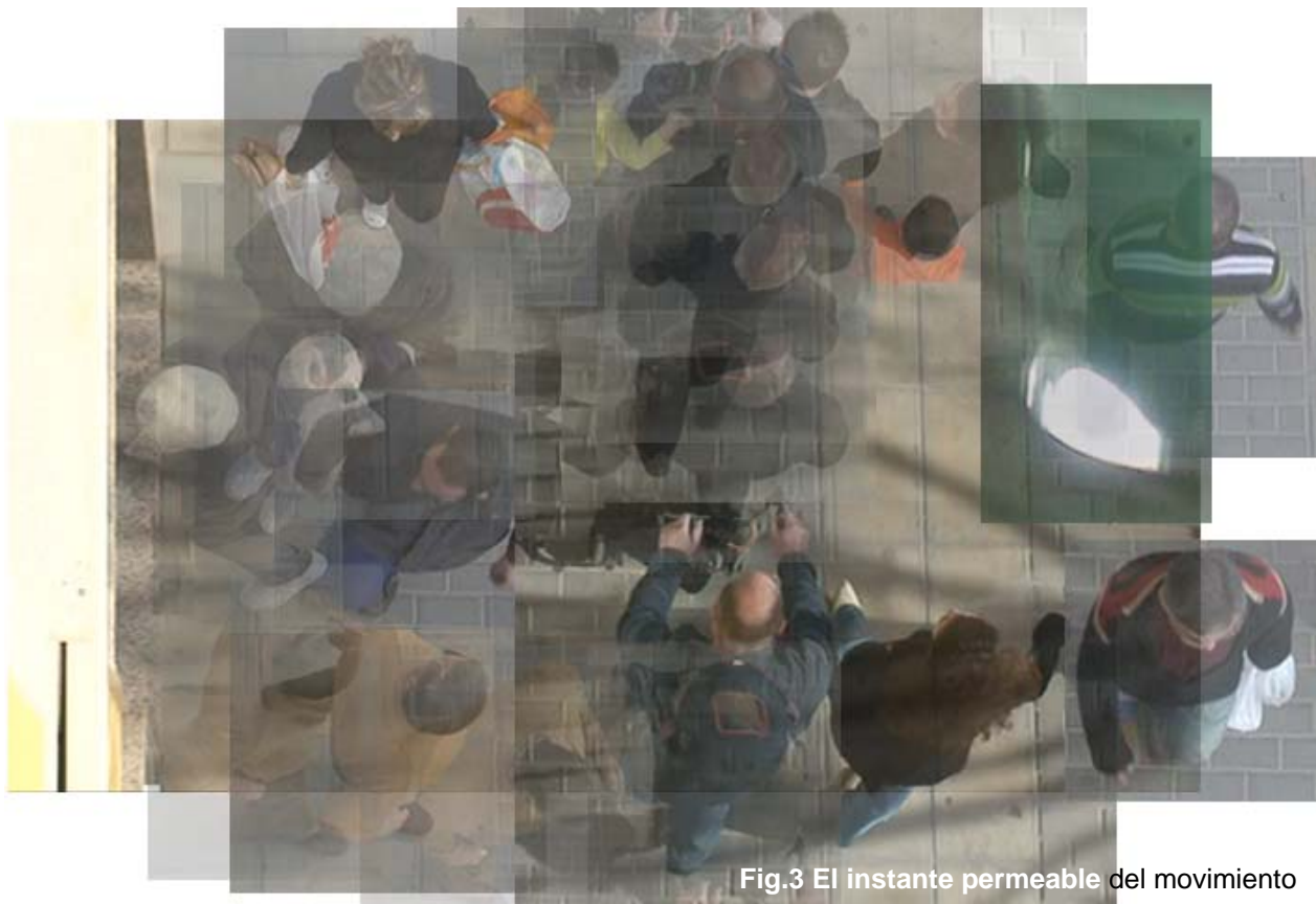
Fig.3 El instante permeable del movimiento

Del siguiente mapa ( fig.3 ) (del que podríamos obtener, al trabajar sobre él el de movimientos) podemos resaltar varios aspectos, a saber: