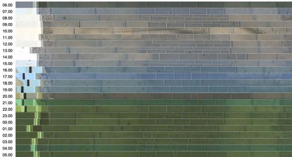
Fig.4 El cambio no tan sutil de la luz

Es en el mapa propuesto en la figura anterior ( fig.4 ) donde se evidencia el cambio no tan sutil que la luz produce sobre los objetos. El mapa gira un día completo comenzando y terminando a las 5.00 a.m. y pone de relieve: