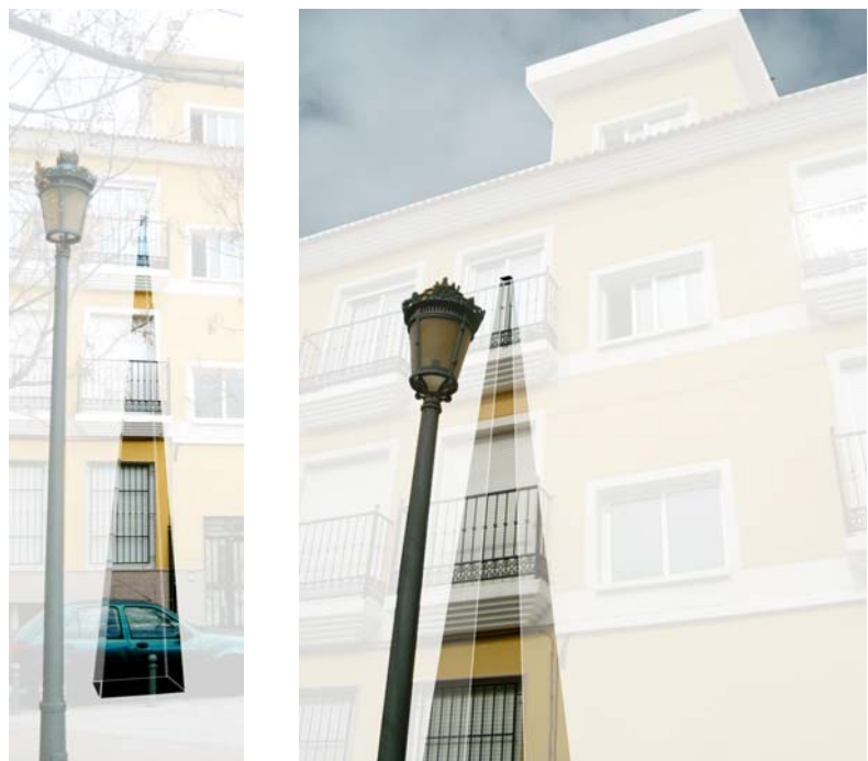
Fig.2: Cualquier lugar pero con el tiempo vertical

El punto de partida por tanto tiene que ver con una concepción del tiempo distinta a la habitual: se observa un lugar en el contexto de un tiempo no lineal aunque acotado, un espacio de tiempo comprendido como superposición de instantes con el objetivo de realizar un procedimiento que sea útil a la hora de arrojar una nueva perspectiva sobre los objetos que estudiamos. Se entiende de esta manera el tiempo como vertical frente a la linealidad consecutiva de la horizontalidad en un tiempo estructurado [3], y ello genera la elección del punto de vista. (fig.2)