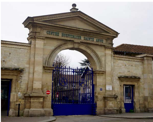
Hospital psiquiátrico de Sainte Anne

El hospital psiquiátrico de Sainte Anne, situado al sur de París (Francia) acaba de cumplir los 150 años de su inauguración en 1867. Se trata de un centro hospitalario con una larga historia, de referencia en la reforma psiquiátrica a lo largo del siglo XIX y XX. Este centro, testigo del nacimiento en 1952 del primer neuroléptico de la historia, el Largactil, creado por Jean Delay y Pierre Deniker y con él, de la psicofarmacología (Imagen 1). Con motivo del 150 aniversario, el hospital ha publicado un libro titulado " L'hôpital Sainte-Anne: Pionnier de la psychiatrie et des neurosciences au coeur de Paris " (Somogy Editions d'Art). Esta obra hace un recorrido por los 150 años de existencia de dicha institución. Sin embargo, esta obra adolece de un estudio de sus orígenes. El objetivo de dicho artículo es realizar un recorrido por la historia de los orígenes del hospital hasta la fundación definitiva del mismo.