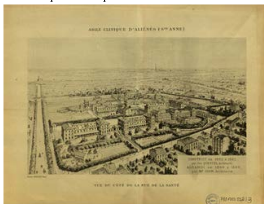
Imagen 5: Vista del Asilo Sainte Anne construido por Questel en 1867.

Finalmente, el Barón Haussmann encargó la construcción del asilo al arquitecto Charles-Auguste Questel. Para la construcción se compraron los terrenos colindantes a la granja, hasta llegar a una superficie de 13 hectáreas y se proyectó construir un asilo con capacidad para albergar 600 alienados, distribuidos en pabellones, con dormitorios de 12 camas. El hospital quedó inaugurado el 1 de enero de 1867 y recibió el primer paciente el 1 de mayo del mismo año XI .