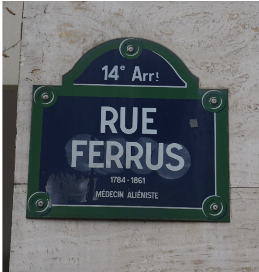
Imagen 4: Placa dedicada al doctor Ferrus en Paris

“El trabajo proporciona tranquilidad; en los casos recientes, contribuye material y eficazmente a la curación”