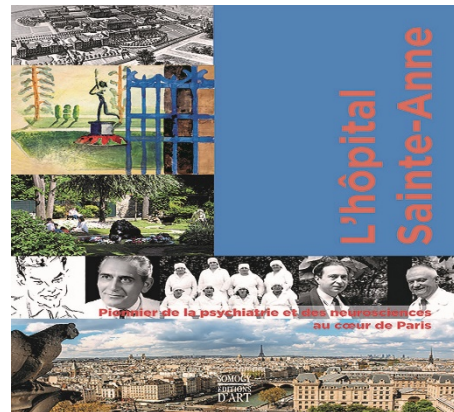
Imagen 2: Portada del libro conmemorativo del 150 aniversario del hospital.

Los primeros testimonios del hospital remontan a 1645, cuando la reina Anna de Austria, madre de Luis XIV planeaba el traslado de la Maison de Santé Saint Marcel (institución destinada a acoger enfermos contagiosos) dada su cercanía con la abadía que visitaba con frecuencia. El lugar elegido se encontraba en el arrabal de Saint Jacques (localización del actual hospital), siendo adquirido el 27 de abril de 1646. El intercambio de terrenos tuvo lugar el 7 de julio de 1651. La utilización de la piedra extraída de las canteras subterráneas permitió la construcción rápida de los primeros edificios, terminados en 1656, ralentizándose a continuación. En 1678, dichos edificios se encontraban aún desocupados. Durante el siglo XVIII, el lugar se transformó en una granja. A partir del 28 de abril de 1767, se aceptó ingresar enfermos provenientes del hospital Bicêtre, durante una epidemia de escorbuto. El 11 de julio de ese mismo año, todos los enfermos volvieron a ser trasladados y el hospital cerrado de nuevo. Queda constancia de la instalación del granjero Colin, una explotación bovina en los terrenos de Sainte Anne, a partir de 1779 por un alquiler anual de 200 libras 1 .