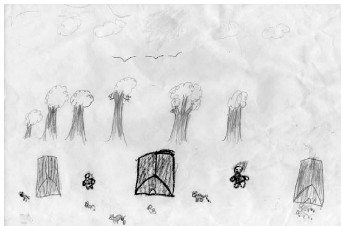
Figura 4 – Expressão artística livre de criança indígena Haliti-Paresi de 8 anos, em resposta ao questionamento: O que você sabe sobre Hantavirose? Julho de 2015 Tangará da Serra - MT, Brasil.