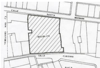
Figura 1: Ubicación del inmueble según el P.G.O.U del 82.

Ubicadas en la calle Purísima de Benissa, nº 57, encontramos la Casa Palau de Andresses y en el nº 59, la Casa de Pere Bigot, dos edificios emblemáticos de la arquitectura Valenciana de los siglos XVII y XVIII, respondiendo a la tipología palaciega que se adopta en la Marina Alta. Siguiendo un orden cronológico, se observa que ambos edificios se construyen por agrupación de dos parcelas rectangulares típicas del medievo, en las que primero se construyen edificaciones de los siglos XVI y XVII para luego ser anexionadas y modificadas según el gusto del XVII (Ver Figura 1).