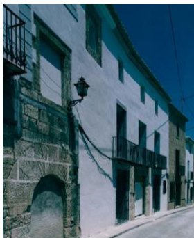
Figura 5: La fachada del XVII se ha sacado a la luz en el lateral de la dieciochesca.

En una operación de tintes arqueológicos decidimos sanear la piedra vista y remarcar los restos de fábricas antiguas que se han encontrado ocultos bajo los revestimientos barrocos, de forma que, considerando las estructuras del S. VXIII como base del edificio, se pudieran reconocer los elementos de épocas anteriores (Figura 5). Todo ello, siguiendo el criterio de mínima actuación sustitutiva de elementos originales. Además, es imprescindible aclarar que al ser necesario recrear los muros se proyecta su ejecución a base de medio pie de ladrillo Perforado clase V, cámara y medio pie de ladrillo hueco clase NV, todo ello retranqueado del plano de fachada y separado de la mampostería por un vierteaguas cerámico.