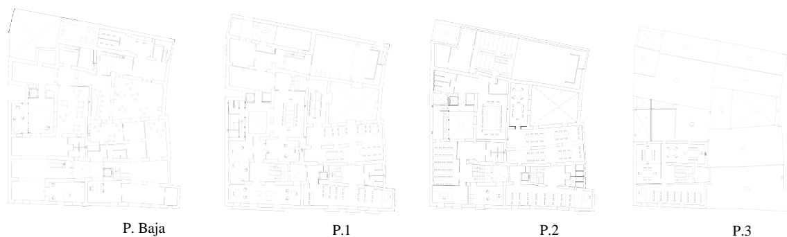
Figura 4: Estado de los edificios antes de la intervención.

Se trata de dos edificios construidos en el siglo XVIII, anexionando cada uno dos casas del siglo XVII, lo que da lugar a parcelas de aproximadamente 15x30 m. La tipología de las dos edificaciones responde a las casas señoriales o palacios urbanos valencianos, con una composición en tres niveles para la casa de Pere Bigot; respetándose la mayoría de los elementos originales, mientras que la Casa Palau dels Andresses tiene un piso más, con un total de cuatro y entreplantas que reflejan la importante modificación a la que fue sometida y la necesidad de crear espacios complementarios a la vivienda. De hecho, en las plantas se refleja esta distribución jerárquica (Figura 4) ya que la baja se destina a servicios de la casa o ligados a la actividad agrícola, siguiendo el esquema tradicional, la principal a residencia de los señores y la cambra a almacenes y residencia de la servidumbre.