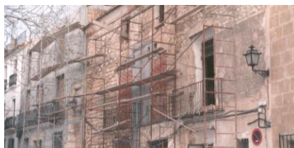
Figura 3: Estado de los edificios antes de la intervención.

Es más, por una parte, con un marcado carácter arqueológico, intentando recuperar los restos físicos de las distintas épocas (Figura 3), lo cual no era fácil (arcos cerrados por tabiques con pinturas dieciochescas, fachadas superpuestas con huecos tapados y otros nuevos abiertos, etc...) y por otra, arquitectónico, ya que debía servir para uso universitario con todas sus condiciones funcionales ajustadas a la normativa (instalación eléctrica, aire acondicionado, sistemas contra incendios, ascensores...). Es entonces cuando comenzaron a fijarse los criterios para la adaptación a unos usos muy distintos de aquellos que dieron forma a las Casas Palacio de Andresses y de Pere Bigot.