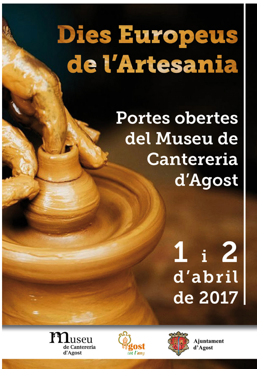
Figura 6. Jornades de portes obertes organitzades amb motiu dels Dies Europeus de l'Artesania. Arxiu gràfic del Museu de Cantereria.

El Museu ofereix visites guiades a grups en diferents idiomes 4 , a més de l'elaboració de tallers didàctics per a grups d'escolars que tenen com a fil conductor l'ús i modelatge del fang. A més, el Museu compta amb una sala dedicada a les exposicions temporals, la majoria de les quals es realitzen amb recursos propis. Periòdicament es celebren jornades de portes obertes amb motiu de diverses dates especials, com els Dies Europeus de l'Artesania, o coincidint amb la fira artesanal i gastronòmica que té lloc al voltant de la festivitat del 9 d'octubre.