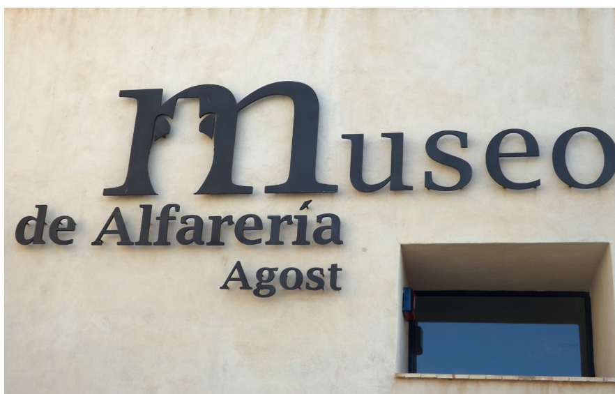
Figura 3. Façana del Museu de Cantereria.