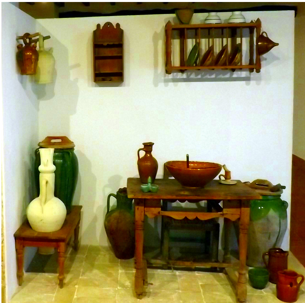
Figura 4. Recreació d'una cuina tradicional en l'exposició permanent del Museu.

Els treballs en l'edifici es van prolongar quasi una dècada, de manera que per tal de no tancar el museu i cancel·lar les seues activitats, es van traslladar els fons a una seu provisional, situada molt a prop, en el número 12 del carrer Teuleria. Allí s'ubicava una antiga fàbrica de ceràmica, La Navà. Una part de les instal·lacions s'havien adaptat com a apartaments rurals, de manera que la seu provisional del museu es va allotjar en l'àrea encara no rehabilitada. El fet de triar aquesta ubicació responia a la necessitat d'albergar una sala d'exposició permanent, així com altres espais dedicats als tallers didàctics, a més de facilitar el trasllat de la col·lecció museogràfica.