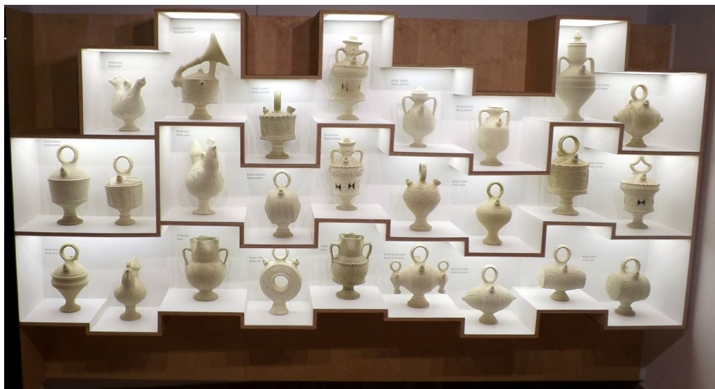
Figura 5. Zona dedicada a la decoració brodada en els botijons.

El discurs museogràfic es divideix en dos grans meitats: d'una banda, la presentació de l'evolució de la cantereria i els productes creats pels canterers, mostrant una continua tasca d'innovació en un ofici que, pel fet de tindre l'etiqueta de "tradicional", pot semblar inalterable al llarg del temps; d'altra banda, el procés d'elaboració de la ceràmica, des del treball de la matèria primera (argila), fins a la cocció en el forn "àrab".