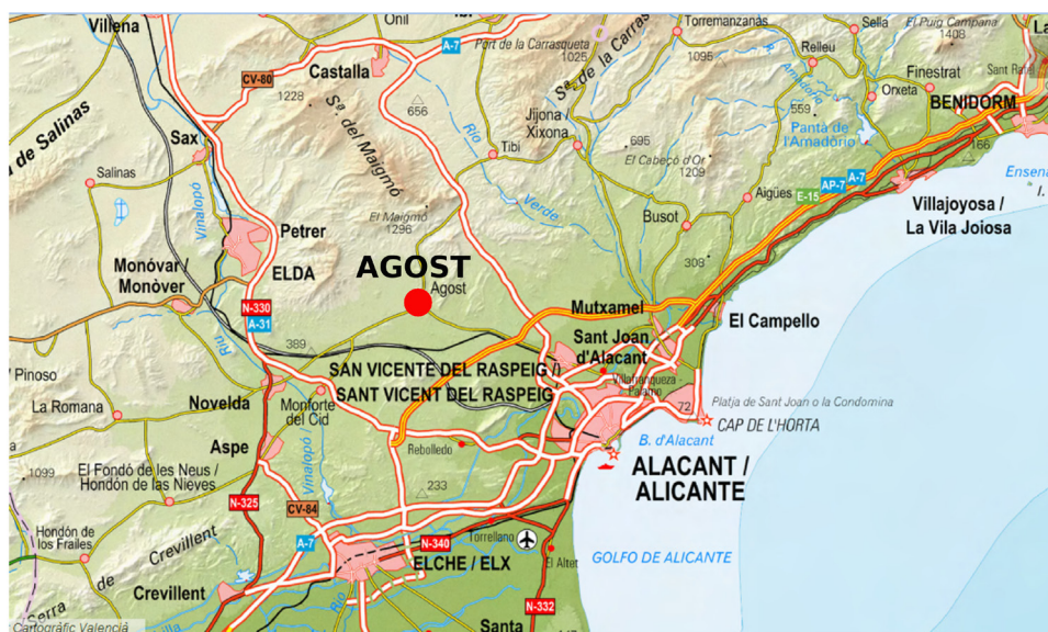
Figura 1. Situació d'Agost en relació a la ciutat d'Alacant. Elaboració pròpia.

Agost és una localitat situada a 18 km al nord-oest de la ciutat d'Alacant, en la comarca de l'Alacantí, entre valls i les serres del Ventós i el Maigmo al nord, dels Tajos al nord-est, el Cid al nord-oest i, finalment, la serra de les Àguiles al sud-oest, predominant un paisatge de matolls, sec. Les terres majoritàriament són terciàries, documentant-se en bona part del terme municipal una gran quantitat de fòssils que, juntament amb l'existència de diversos punts en els quals es pot advertir el límit K/T 1 , revelen la gran riquesa paleontològica que amaga el subsòl d'Agost.