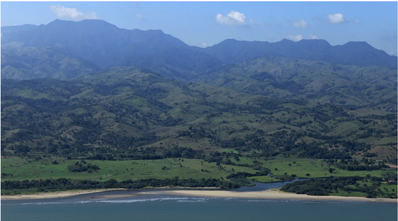
La sierra de Los Tuxtlas desde el mar, al fondo los macizos de Santa Marta y San Martín Tuxtla

Cuando la descubrieron los blancos, la vieron como un enclave de verdor y exuberancia, la tierra prometida, de inmensas extensiones feraces y despolbladas, legendaria por su intensa actividad volcánica y sísmica, una fortuna de riquezas naturales, al que penetraron por nuevos caminos, abiertos por el ganado, que se adentró en la sierra, descubriendo