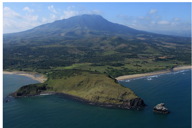
La sierra de Los Tuxtlas desde el mar, al fondo el volcán de San Martín Tuxtla

El agua que flota en el aire y empapa el suelo predispuso el paisaje que forjó la cultura olmeca, dando lugar al mito de Los Tuxtlas, el corazón de Mesoamérica, donde se agitan las entrañas de la tierra y del cielo, donde hombres, plantas y animales se encontraron y desenterraron incansablemente, inventándose entre sí, en una quimera de humedad, luz, sombra, fragor y color. Una epopeya del empeño humano prolongada y vigorosa cuyo desenlace es fascinante como la selva misma.