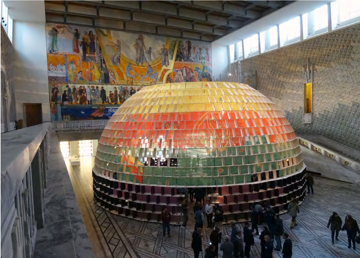
Imagen 1. Montaje de la cúpula diseñada por Studio Jonas Staal en colaboración con las comunidades kurdas de Rojava, Siria, para la instalación “The Embassy”, Ayuntamiento de Oslo, 25 de noviembre de 2016

Ese primer día, al terminar las visitas, las y los estudiantes se trasladaron al Ayuntamiento de Oslo para colaborar en el montaje de la cúpula que albergaría los dos días de debates auspiciados por la instalación The World New Embassy: Rojava .