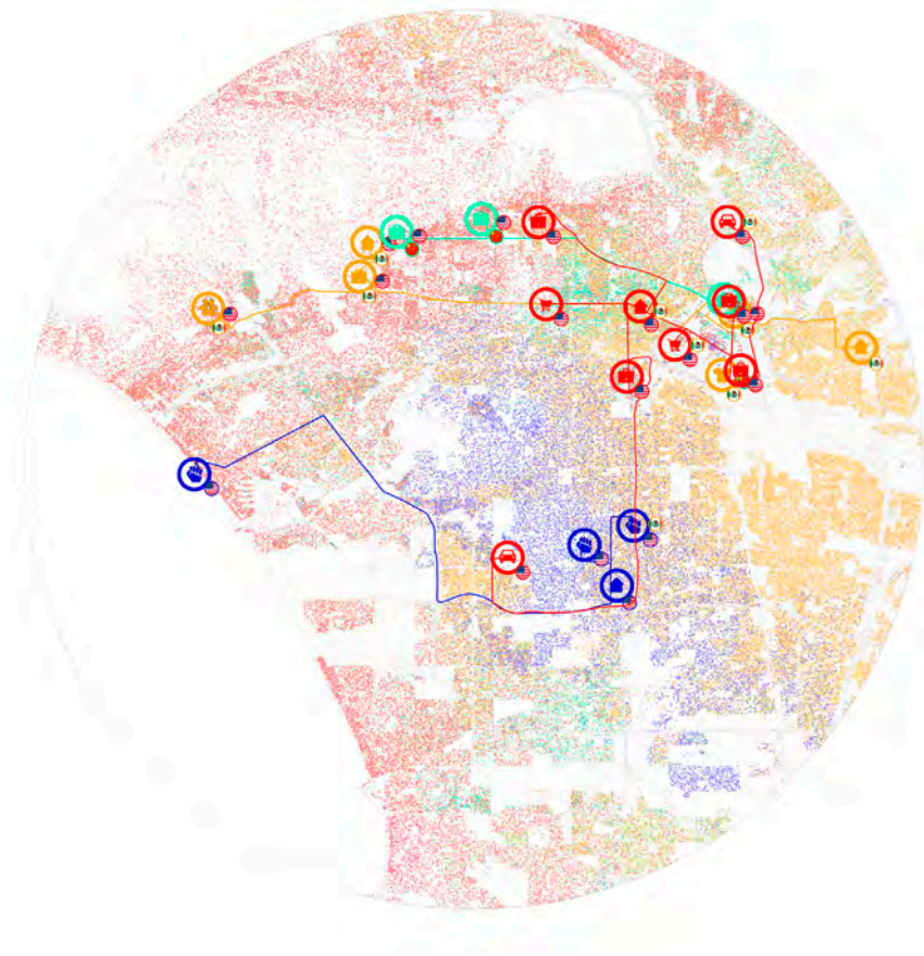
Imagen 3. Andrea Olivares, estudiante de Máster: análisis previo al proyecto de TFM. Mapa de Los Ángeles en el que se han incluido los recorridos realizados por los protagonistas de cuatro películas recomendadas.