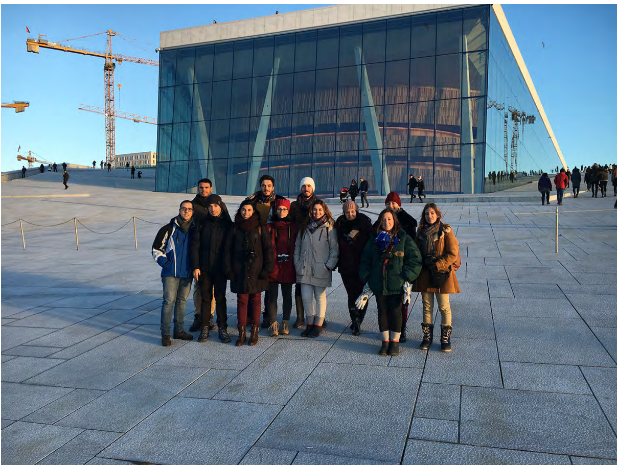
Imagen 2. Parte del grupo de estudiantes de Máster durante la visita a la Ópera de Oslo diseñada por Snøhetta

Día 3/ 27.11.2016. En este tercer día se planteó la visita a dos barrios residenciales que pueden ser tomados como ejemplos de transformaciones de antiguas zonas portuarias de carácter industrial en