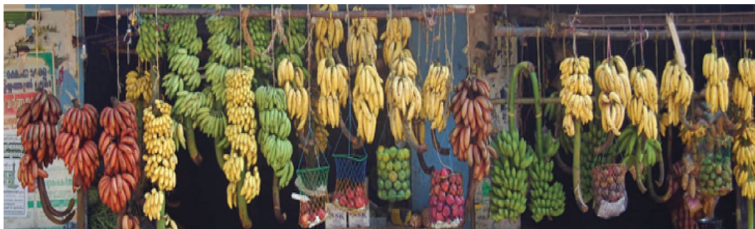
Figura 1. Diversidad de plátanos cultivados en la región centro del Estado Veracruz.

En México, las variedades que se cultivan son: el Enano gigante, Macho, Manzano, Morado, Pera, Tabasco, Valery y Dominicó (SAGARPA, 2017) (Fig. 1). En México el 38% de la superficie de plátano cuenta con tecnificación de riego, lo cual genera el 51% del volumen y el 46% del valor total de este fruto. De acuerdo con los datos de información Agroalimentaria y Pesquería, la superficie sembrada es de 75.337 ha distribuidas en los estados de Campeche, Colima, Chiapas, Guerrero, Jalisco, México, Michoacán, Morelos Nayarit, Oaxaca, Puebla, Quintana Roo, Tabasco, Veracruz y Yucatán. Veracruz es uno de los estados más productivos con un volumen de 2.208.651 toneladas anuales (SAGARPA, 2017) Sin embargo, de acuerdo a SIAP (2013-2017) la producción del país aumentó un 12.9 % hasta 270.000 toneladas (2017). En el Estado de Veracruz, se cultivan 10 variedades siendo el “plátano dominico” una de las más cultivadas (Noa-Carrazana & Flores-Estévez 2008). Entre los municipios veracruzanos más destacados en la cosecha de plátanos, se encuentra la municipalidad