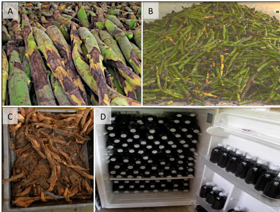
Figura 3. A-B) Raquis de plátano apilados después del proceso de corte y separación de las manos de plátano. C) Fibras de los raquis obtenidas del proceso de lixiviado. D) Lixiviados refrigerados obtenidos en Tlapacoyan, Veracruz (Foto: Valencia-Ordoñez, 2015).