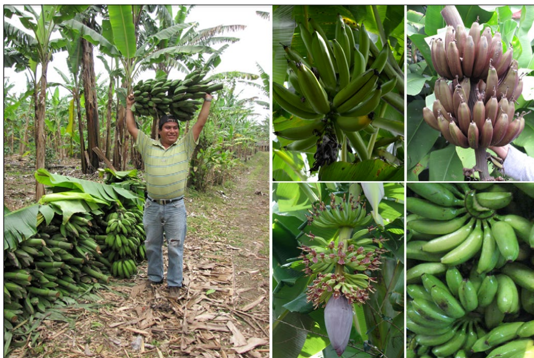
Figura 2. Cosecha tradicional de plátanos en Tlapacoyan, Veracruz.

Por otra parte, en la producción de plátano como en la mayoría de los sistemas de producción agrícola se generan grandes cantidades de desecho orgánico. Como se observa en la Fig. 3, el proceso productivo del plátano ocasiona desechos como la fruta de rechazo, los pseudotallos, la hojarasca y principalmente los raquis. A pesar de algunas propuesta de reciclado de los raquis, como es el caso de obtención de papel (Russo, 1995), estos no son aprovechados adecuadamente. Los lixiviados de raquis, al ser un producto de la misma planta, poseen nutrientes esenciales que pueden reutilizarse para el propio cultivo (Cabral, 2006). La reutilización de nutrientes o el uso de fertilizantes orgánicos, aunque ya se encuentran en el mercado, no son totalmente acepta-