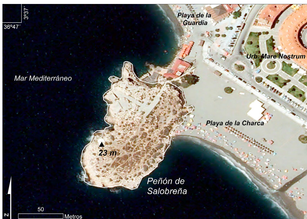
Figura 2. Delimitación propuesta de la microrreserva del Peñón de Salobreña