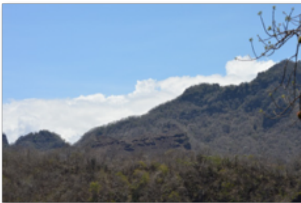
Figura 1. Vista panorámica de la población de Zamia inermis en la Sierra de Manuel Díaz, Monzombo, Veracruz, México

Zamia inermis fue descubierta en un predio particular en 1973 y no fue hasta 1983 cuando se describió formalmente (Vovides et al. , 1983). Para entonces cientos, quizá miles de plantas ya habían sido extraídas con fines de comercialización. Durante años se han realizado extensivos recorridos en la Sierra de Manuel Díaz (Fig. 1), en Monzombo, Veracruz, ubicando únicamente tres subpoblaciones en menos de 2.5 km 2 con un total de 654 individuos, la mayoría de los cuales son adultos no reproductivos.