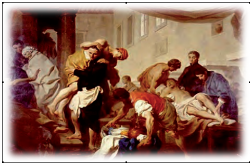
Figura 1. São Camilo de Léllis assistindo aos doentes na enchente do Rio Tibre em 1598. Pintor: Pierre Hubert Subleyras (1745).

Neste sentido, se traz à baila a pintura de Pierre Hubert Subleyras (1745), com o título “São Camilo de Léllis assistindo aos doentes na enchente do Rio Tibre em 1598” (Figura n.1). Ele retrata o episódio significativo da noite de Natal de 1598: uma aluvião 1 , entre os mais fortes e desastrosos, flagelou Roma, de modo particular a região do Hospital Santo Spirito. Sobre uma das colunas de tijolos do pórtico externo, no começo da via Borgo S. Spirito existe a lápide que indica o nível em que às águas lamacentas do rio chegaram.