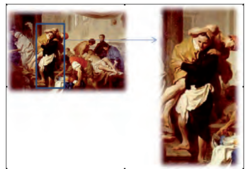
Figura 2. Desdobramento em fragmento da figura n.1 como referência

Em relação às vestes das pessoas retratadas, três encontram-se vestidas de túnica em tom escuro, possivelmente, preta, ostentam o símbolo da cruz em tom vermelho. Dos três citados, um encontra-se no lado esquerdo e o outro a direita na tela e ao centro a representação de Camilo de Léllis, que se encontra com um tecido branco envolto seu quadril, como uma espécie de avental ou toalha (Figura 2).