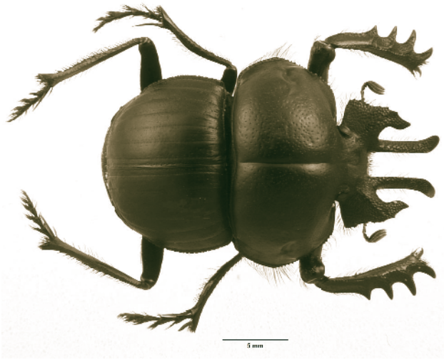
Figura 4. Anomiopsoides nueva especie recientemente descubierta; el género es endémico de la provincia biogeográfica del Monte.

funcionamiento de los ecosistemas, raramente estos son considerados cuando se toman decisiones sobre conservación de la biodiversidad. Una de las razones por las cuales los insectos no son generalmente considerados a la hora de determinar o administrar las áreas protegidas, es el relativamente escaso conocimiento que se tiene de ellos. Las áreas protegidas del Sur de América del Sur cuentan únicamente con listas de especies y éstas son muy incompletas y no hacen mención de la historia natural de las especies de insectos.