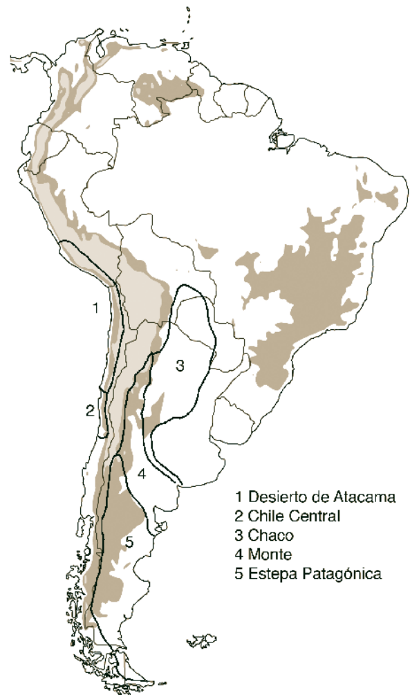
Figura 1. Áreas áridas del sur de América del Sur.

Ciertos grupos de scarabaeoideos son característicos de zonas áridas y se los encuentra en ambientes semidesérticos o desérticos en varias regiones del planeta, por ejemplo Glaresidae y Ochodaeidae.