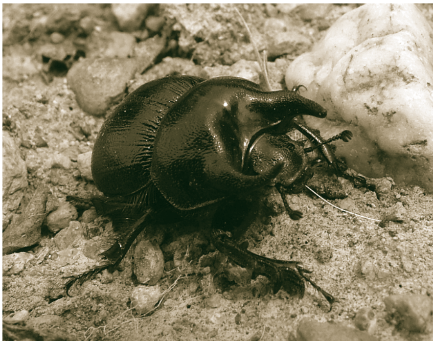
Figura 2. Taurocerastes patagonicus , especie endémica de la Patagonia en el extremo sur de América del Sur.

Como resultado de estudios y expediciones recientes se han descubierto varios géneros y numerosas especies nuevas, algunos de estos taxa han sido descritos y otros se están describiendo en la actualidad. Puelchesia Ocampo y Smith, es un ejemplo de un nuevo género de Pachydemini recientemente descubierto en el Monte (Figura 3) (OCAMPO & SMITH, 2006), otros dos géneros nuevos de Pachydemini están en proceso de ser descritos por Ruiz-Manzanos & Ocampo. Especies nuevas han sido encontradas para los géneros Glaresis Erichson (Glaresidae), Parochadeus Nikolajev (Ochodaeidae), Anahi Martínez y Neogutierrezia Martínez (Melolonthinae: Pachydemini), Eucranium Brullé y Anomiopsoides Blackwelder (Figura 4) (Scarabaeinae, Eucraniini), Aclopus Erichson y Neophaenognatha Allsopp (Aclopiinae) y la lista continúa. Estos