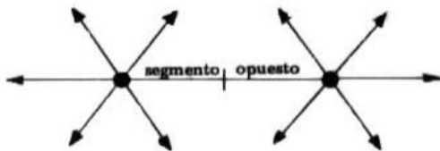
Fig. 4. Articulación A-B, Institucional-(versus)-doméstico (Pacotte, 1936).

Iniciamos una deriva intramuros desde la ' policy ' estadocéntrica instituida, en el presente perpetuo ' ensanchado ' a partir de la conformación misma de Estado (Unido) en la era del espectáculo 12 . Nos desprendemos pues de la cronología arquitectónica para mapear un cartograma sin orden, jerarquía o inicio-fin. Escogemos relatos de ese continuum sin pretender abarcar "la" realidad.