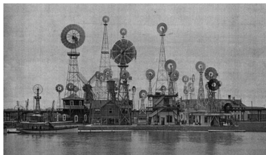
Fig. 8. El relato se acerca a la escala tangible en esta parte de la exposición (s.a., 1893).

El modelo espectacular de la exposición universal se expande también hacia la difusión de la ‘ arquitectura doméstica ’ (sic) en periodo de posguerra: La cocina pasa de los bastidores a la puesta en escena, despojándola de cualquier rastro de vida cotidiana. Ni objetos, ni rotos, ni descosidos. Unas imágenes de felicidad doméstica que perpetúan la cultura heteropatriarcal y de consumo 17 . Razón-deseo se territorializa en público-privado 18 .