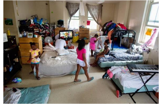
Fig. 1. Refugio en Brooklyn (Fremson, 2013).

«You are required to vacate this property within 72 hours». S. arrienda desde hace 12 años en Brooklyn con su hija. El propietario quiere desalojar el inmueble para elevar el alquiler a los próximos inquilinos. Hoy cuenta su caso en un espacio comunitario institucional, donde se reúne una de las 50 organizaciones por la vivienda de Nueva York. Llevará allí sus pertenencias si no paralizan el desahucio. Un +1 en el listado de 12,302 familias que duermen en los refugios de la ciudad 2 . Su nueva casa: un rizoma.