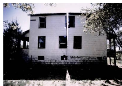
Fig. 10. Splitting, el acto de dar luz a lo cotidiano, 'lo común' (Matta-Clark, 1974).

De la archi-cultura hegemónica del modelo Pullman, que mutará hacia el community land trust 20 , a la anarquitectura de Matta-Clark. En el siglo del ' cierre del mapa ', donde el último milímetro cuadrado de la Tierra está cartografiado y apropiado, la escala 1:1 del espacio tangible situado escapa al sistema de medida, a la retícula abstracta. Matta-Clark desterritorializa lo doméstico en ' Splitting ' y la propiedad en ' Fake Estates '. Bisecta el American Dream eludiendo el método de representación disciplinar: Si la sección representada insiste en separarse y ser separado, la sección territorializada desvela las sombras de las copertenencias. Sección versus domesticidad compartida 21 . El corte es la puerta entreabierta entre lo instituido y lo instituyente, lo ' común ', la subversión de la disciplina, el rizoma, la revuelta.