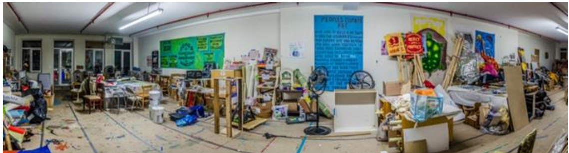
Fig. 2. Arquitectura para el arte low-cost comunitario (Mayday Collective, 2014).

A. y M. son de Brooklyn. En 2013 se lanzaron a la aventura del 'Dolt Yourself, Dolt With Others': «Una casa para el pensamiento crítico y el debate» 4 , un espacio de encuentro autogestionado por la propia comunidad. Vecinos y colectivos han reformado dos inmuebles para la materialización de eventos culturales, reuniones, talleres, huerto urbano o cafetería.