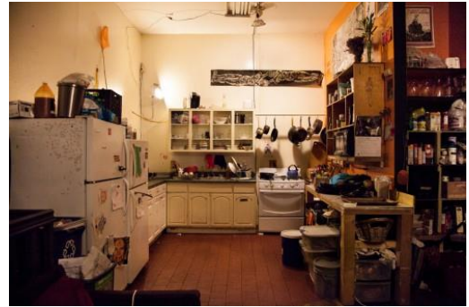
Fig. 3. Lo ordinario como práctica emancipadora (Crenshaw, 2015).

R. es aficionada al teatro. Organiza pases libres en un espacio de creación, independiente de los circuitos convencionales del arte y el mercado actual: MAs House también es su casa 5 . Se constituye no solo como proyecto cultural, sino como una comunidad de afectos y cuidados donde los usos de cada metro cuadrado se entretrejen y mutan día a día.