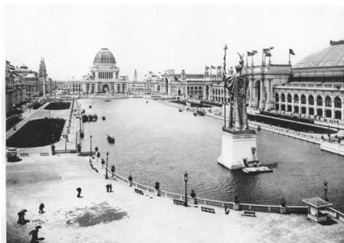
Fig. 7. El relato íntimo desaparece del mapa en la exposición (Arnold, 1893).