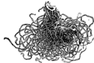
Fig. 5. Articulación AB, DomésticoInstituyente (Lloyd & Lloyd, 1884).