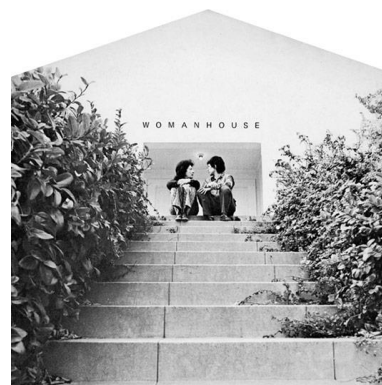
Fig. 9. Womanhouse, la 'casa' como espacio de copertenencia (Woodman, 1972).

« La osadía [de Womanhouse] no consiste únicamente en la salida platónica y la ascensión hacia el exterior; más allá de eso supone una reafirmación del territorio doméstico en un territorio completamente extraño » (Berbel, 2015).