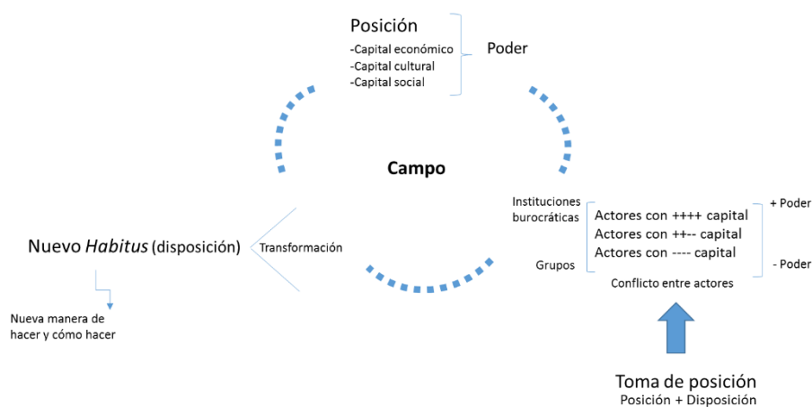
Figura 1. Elementos de la estructura del campo y condiciones necesarias para su reconfiguración

Elaboración a partir de la teoría de Bourdieu (Oliveira, 2016)