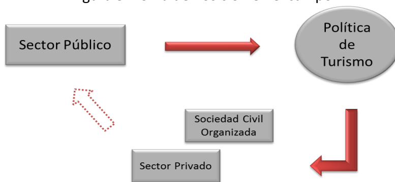
Figura 3. Toma de Posición en el campo

un énfasis dado por parte del Estado a la democratización y a la participación ciudadana en la toma de decisiones públicas. De esa manera, el sector público es el responsable por decidir cuales son las políticas que van entrar en la agenda, no existe una participación que conlleve a un consenso sobre el que será mejor para todos los involucrados.