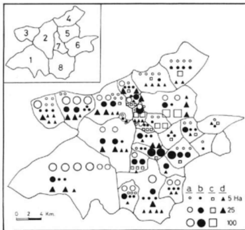
FIGURA 2. Distribución de las superficies de frutales. Leyenda; a, manzano; b, melocotonero; c, cerezo; d, ciruelo, peral y albaricoquero.

La plantación recibe unas 5 ó 6 labores al año y los abonos y tratamientos adecuados. En esta zona de montaña, debido al clima, el melocotón sufre menos ataques de ceratitis , que pueden causar estragos en otras áreas. Aun así, es una especie muy afectada por problemas fitopatológicos (pulgón verde, fusicoccum , etc.), lo cual explica la incidencia de los tratamientos fitosanitarios que pueden suponer más de la quinta parte del costo de producción.