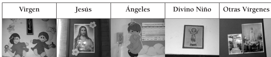
Tabla 2 Ejemplos de representaciones visuales de figuras humanas con contenido religioso