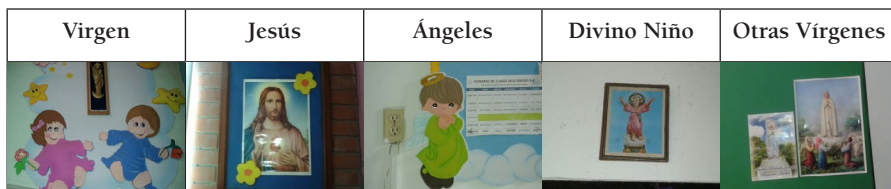
Tabla 2 Ejemplos de representaciones visuales de figuras humanas con contenido religioso