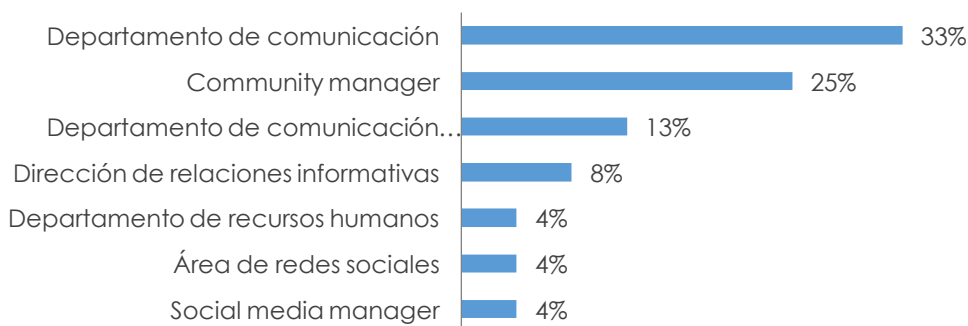
Gráfica 5. Gestión de la comunicación corporativa a través de redes sociales virtuales

Nota: Datos porcentuales calculados sobre las empresas que respondieron a la encuesta y contaban con gestores diarios de los perfiles corporativos en redes sociales virtuales (24). Los porcentajes no suman 100% porque hay respuestas que indicaban varias áreas o equipos sin especificar.