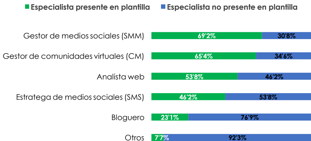
Gráfica 3. Tipología de nuevos especialistas en comunicación digital en el IBEX 35

Además de los perfiles gestores, también destaca la inclusión de un analista de datos en más de la mitad de las empresas. Contar con dicho profesional resulta de gran interés para evaluar los resultados de las estrategias de comunicación proactivas, pero, además, es imprescindible para aquellas entidades que únicamente desean mantener una presencia reactiva en las redes, es decir, escuchando o monitorizando lo que se dice sobre su marca, productos o servicios en la Red.