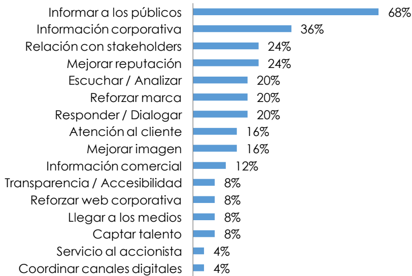
Gráfica 6. Objetivos de la comunicación corporativa desarrollada a través de redes sociales

Nota: Datos calculados sobre el total de las empresas que respondieron al cuestionario y empleaban redes sociales corporativas (25). Los porcentajes no suman 100% porque la mayoría indicó varios objetivos.