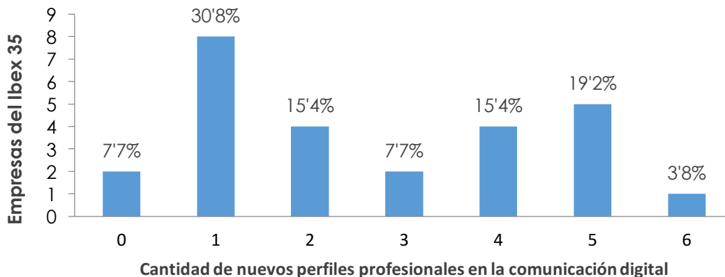
Gráfica 2. Variedad de especialistas en comunicación digital en el IBEX 35