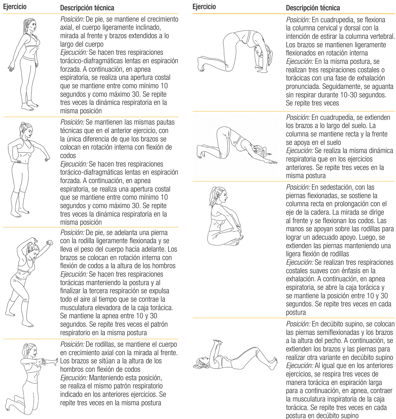
Figura 2. Protocolo de ejercicios realizados por los grupos de intervención

T. Rial, I. Chulvi-Medrano, J.M. Cortell Tormo, M. Álvarez Sáez