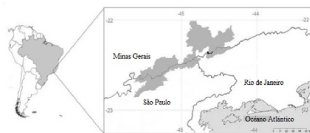
Figura 1. Localización geográfica del área de estudio, marcada en negro.

La región fue inicialmente ocupada por los indios Puris y posteriormente fue sujeta a la extracción de minerales, carbón y producción de café. Al abolirse la esclavitud en 1888, y con ello el declive de las actividades basadas en la mano de obra esclava, se adoptó la política de los “núcleos coloniales” - entre