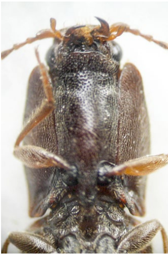
Figura 4: detalle del prosterno (holotipo)