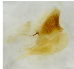
Figura 9: bolsa copultriz de la hembra (paratipo)