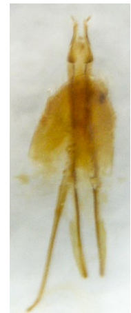
Figura 10: ovopositor (paratipo)

Dimensiones. Longitud 8,4-9,1mm y anchura 2,25-2,75mm.