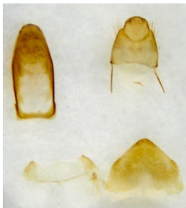
Figura 7: detalle de los terguitos (paratipo)