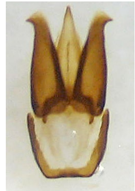
Figura 6: visión dorsal del edeago (holotipo)