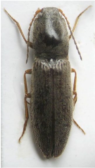
Figura 1: habitus del macho (holotipo)