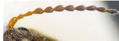
Figura 3: detalle de la antena (paratipo)

Cabeza con punteado intenso, puntos claramente umbilicados muy próximos pero sin llegar a tocarse, separados menos de un diámetro; zona interocular aplanada, muy levemente hundida antes de borde anterior, este grueso y redondeado, algo saliente sobre el epistoma, visto de frente en V abierta (Fig. 2).