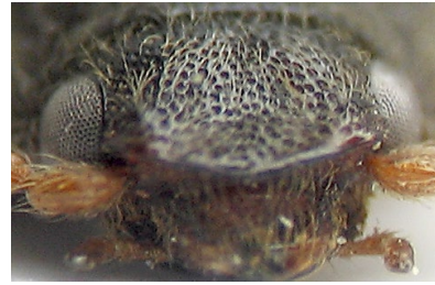
Figura 2: detalle de la frente (paratipo)