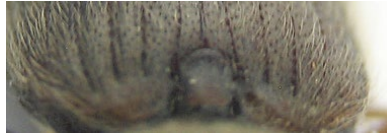
Figura 5: detalle del escutelo (paratipo)