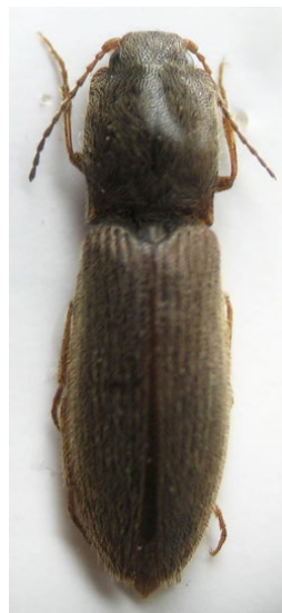
Figura 8: habitus de la hembra (paratipo)