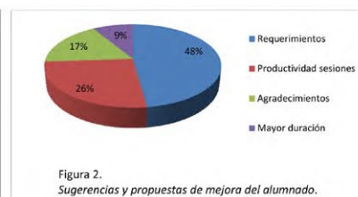
Figura 2. Sugerencias y propuestas de mejora del alumnado.