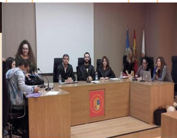
Fig 3: Entorno inmersivo de aprendizaje. Sala de Juicios