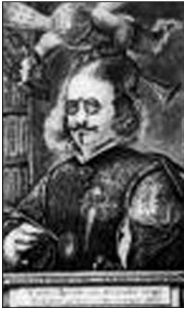
Francisco de Quevedo.