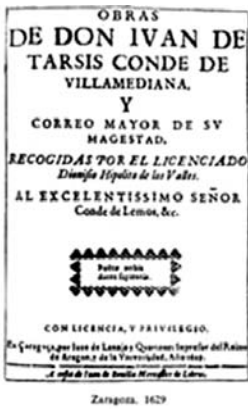
Obras de Villamediana.