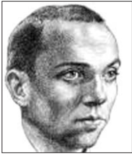
Miguel Hernández. Dibujo de Antonio Buero Vallejo en 1939.