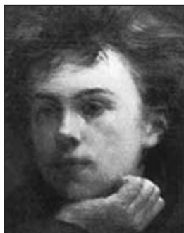
Retrato de Rimbaud por Henri Fantin-Latour, 1872.

27 Pablo Neruda, «Mariano Latorre, Pedro Prado y mi propia sombra», en Obras Completas , IV. «Nerudiana dispersa, I», op. cit., p. 1087.