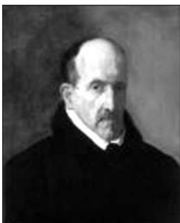
Góngora por Velázquez.

14 Pierre Ronsard, soneto XLIII de Le second livre des sonnets pour Hélène , en Les Amours , Paris, Gallimard, 1974.