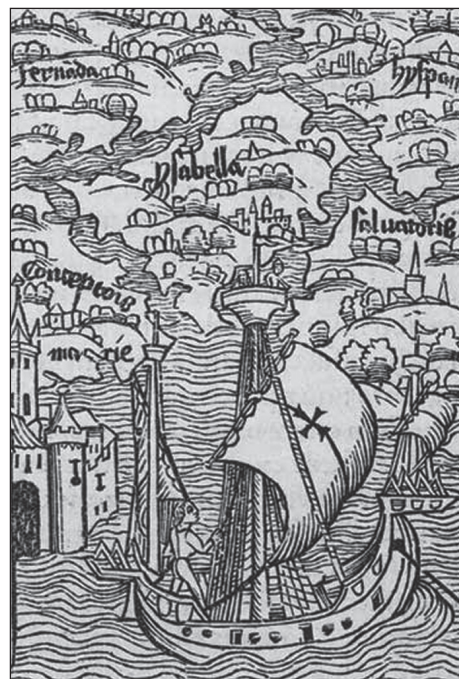
Grabado de la edición de la Carta de Colón a Santángel. Basilea, 1493.

Todo cuanto, sin duda con exceso, hemos expresado viene a justificar para quienes lo estimen necesario –no es mi caso– lo dicho por Abel Posse, o aún mejor, su interpretación de los distintos personajes americanos a no ser que optemos por indianos. Posse no pretende ser un historiador; se desenvuelve,