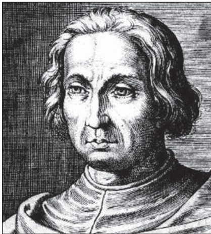
Cristóbal Colón (grabado).