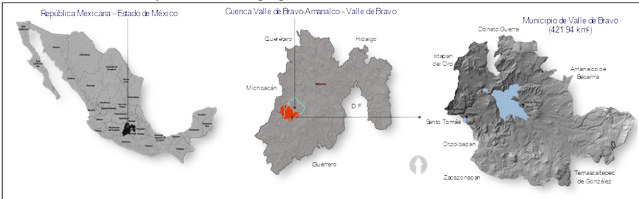
Mapa 1: Localización geográfica de Valle de Bravo, México