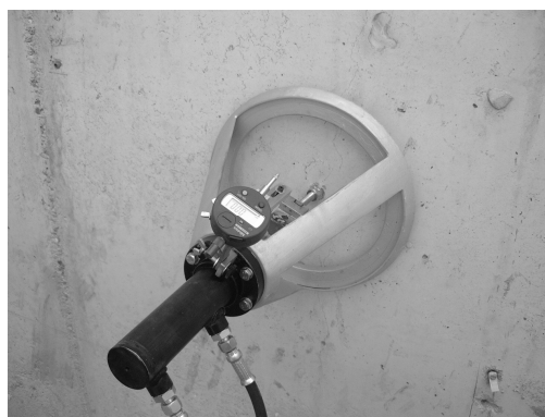
Figura 1: Ensayo de arrancamiento anclaje-soporte.

Las pruebas in situ se realizaron mediante ensayos de arrancamiento anclaje-soporte “pull-out”, con émbolo de presión y bomba hidráulica “Enerpac”, aplicado sobre el anclaje a ensayar.