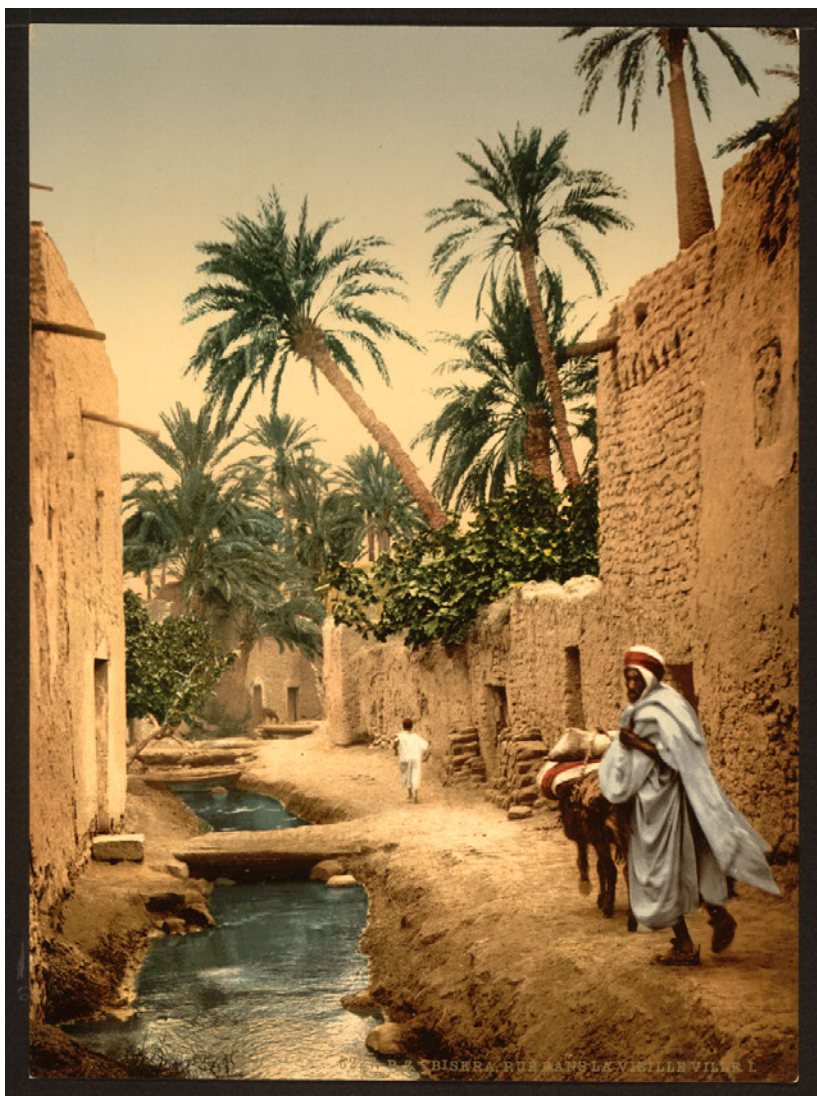
Impresión fotocroma de una calle en Biskra, Argelia, en «Imágenes de pobladores y sitios de Argelia» del catálogo de la Detroit Publishing Company (1905), parte de la colección actual de la Biblioteca Digital Mundial