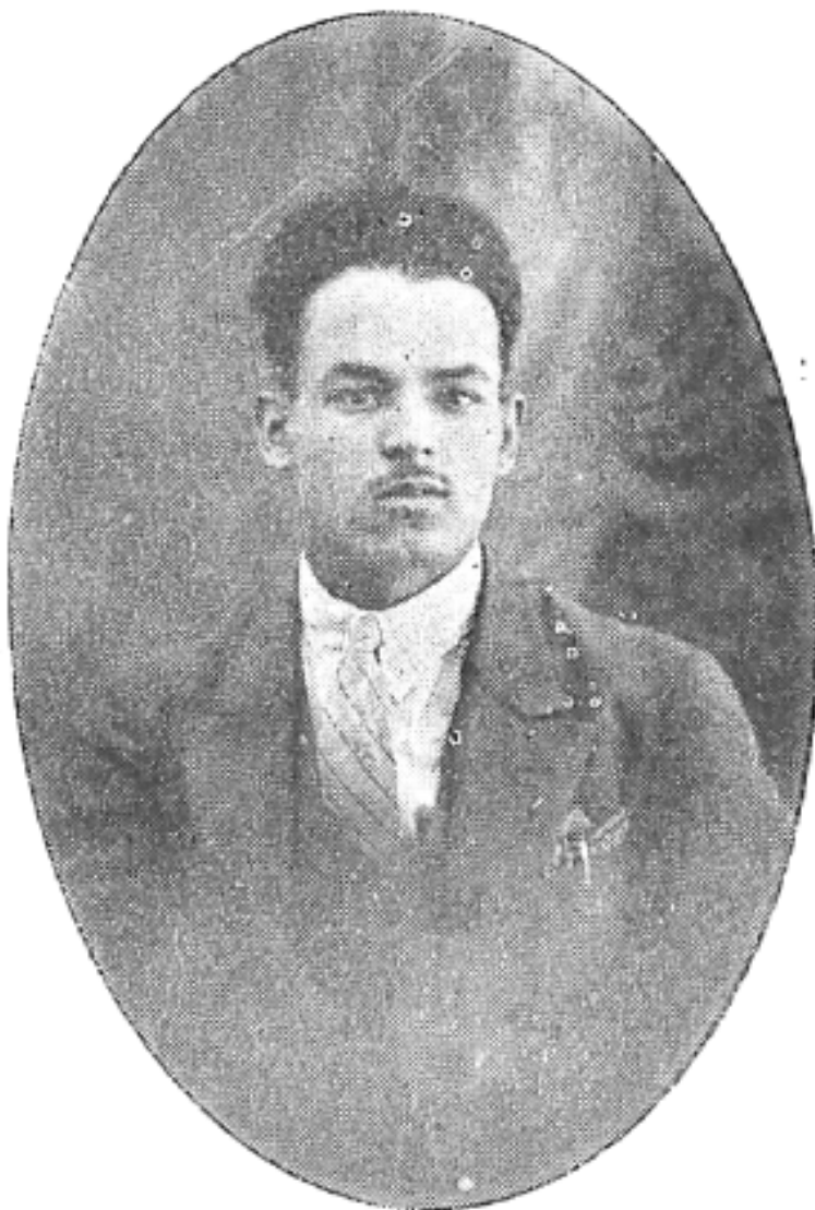
Al-Hādi al-Sanūsī, imagen reproducida en su antología, p. 4