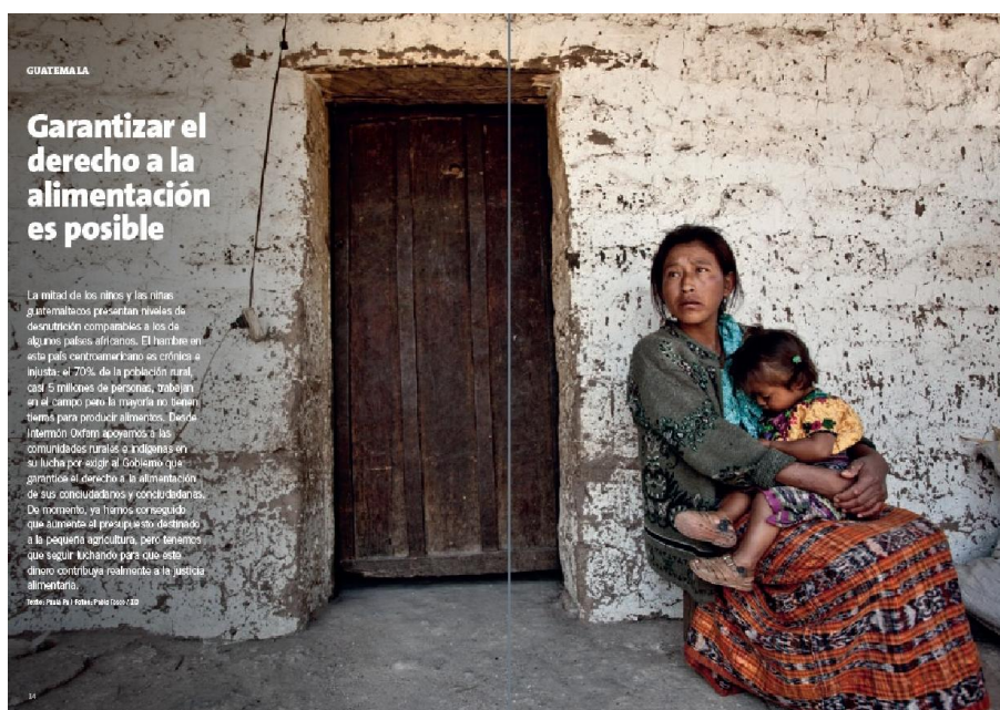
Texto multimodal 1: Revista nº 24 (abril,