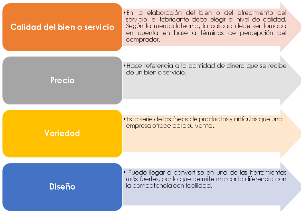
Figura 2: Factores o atributos que influyen en la percepción de imagen