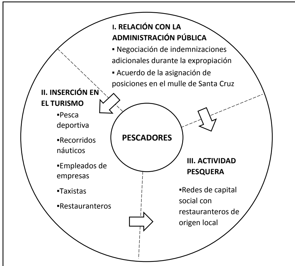
Figura 4. Estrategias adaptativas emprendidas por los pescadores de Huatulco

En la figura anterior se muestran tres áreas alrededor de las cuales los pescadores han actuado para alcanzar metas que les han permitido pervivir como grupo y adaptarse a las condiciones del escenario local. En la primera área, se muestran las estrategias desplegadas frente a los actores gubernamentales durante la etapa expropiatoria y en fechas más recientes cuando, a causa del desarrollo inmobiliario y turístico, se ha expulsado a los pescadores de las playas que ellos empleaban en sus labores cotidianas. Las dos estrategias indicadas permitieron a los pescadores apropiarse de espacios urbanos expropiados y utilizar una sección del muelle para desarrollar sus labores tradicionales y otras nuevas.