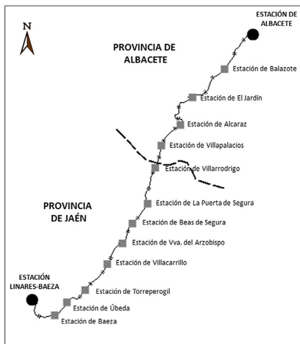
Figura 1. Ferrocarril Baeza-Utiel. Tramo Baeza-Albacete

variada extensión y complejidad 2 . A todo lo anterior se sumaban las numerosas obras de cementación de trincheras, reforzamientos de taludes, etc., que en distintos tramos del recorrido resultaron tan complicadas y costosas como las anteriores. Téngase en cuenta que en algunas de esas partes del trazado existían graves problemas derivados de la inestabilidad de los suelos, que sólo era posible corregir mediante la construcción de enormes diques de cemento con capacidad para contener los deslizamientos y desprendimientos en masa.