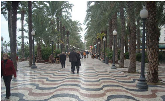
Fig. 7 – Paseo de la Explanada de España. Alicante.

que después se construyeron para alojar la actividad hostelera del puerto de ocio (fig. 8).