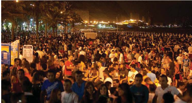
Fig. 2 – Participación ciudadana en la playa del Postiguet en las Hogueras de 2012.