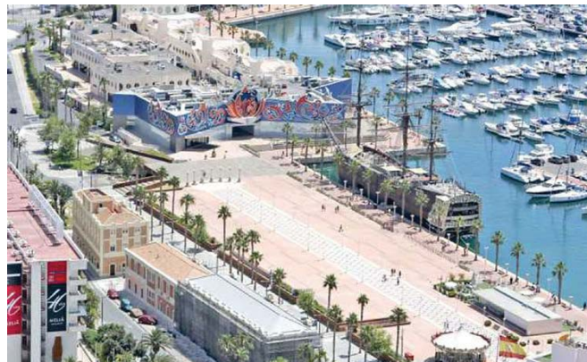
Fig. 8 – Vista aérea del puerto de Alicante¹.

Del estudio se concluye la capacidad transformadora que en este sentido posee la intervención artística, para revitalizar