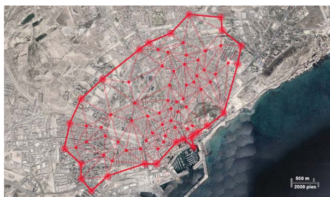
Fig. 1 – Representación por triangulación de la ciudad de Alicante a partir de la georeferenciación de los monumentos plantados en 2013.

a través del arte. Este es el modo por el cual la convivencia con las manifestaciones artísticas en el espacio urbano así como el placer de sentir y disfrutar del arte forman hoy parte inseparable de la cultura alicantina (Sebastiá García, 1988 y Tejeda Martín, 1995).