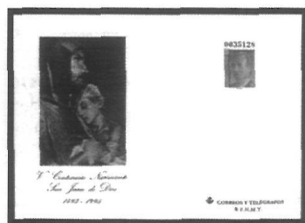
Figura n° 14.