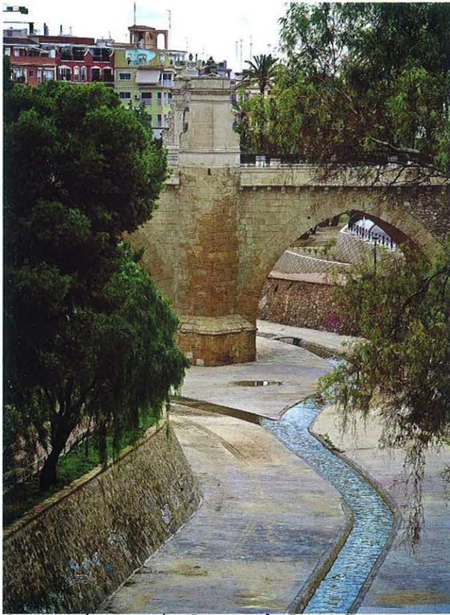
Imagen de portada: Puente de Santa Teresa sobre el Río Vinalopó.