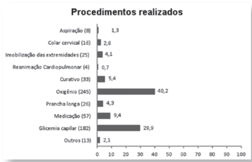
Gráfico 02 – Frequência dos procedimentos realizados durante atendimento a homens idosos pelo SAMU de Teresina.

O panorama atual do Brasil quanto a morbimortalidade masculina assemelha-se ao padrão de outros países, em que os coeficientes de mortalidade masculina apresenta-se cerca de 50% maiores em relação ao sexo oposto. Segundo os autores, dentre as causas desse dado, sobressaem mortes por doenças do aparelho circulatório seguidas por aquelas relativas a acidentes e violências (Laurenti; Jorge; Gotlieb, 2005).