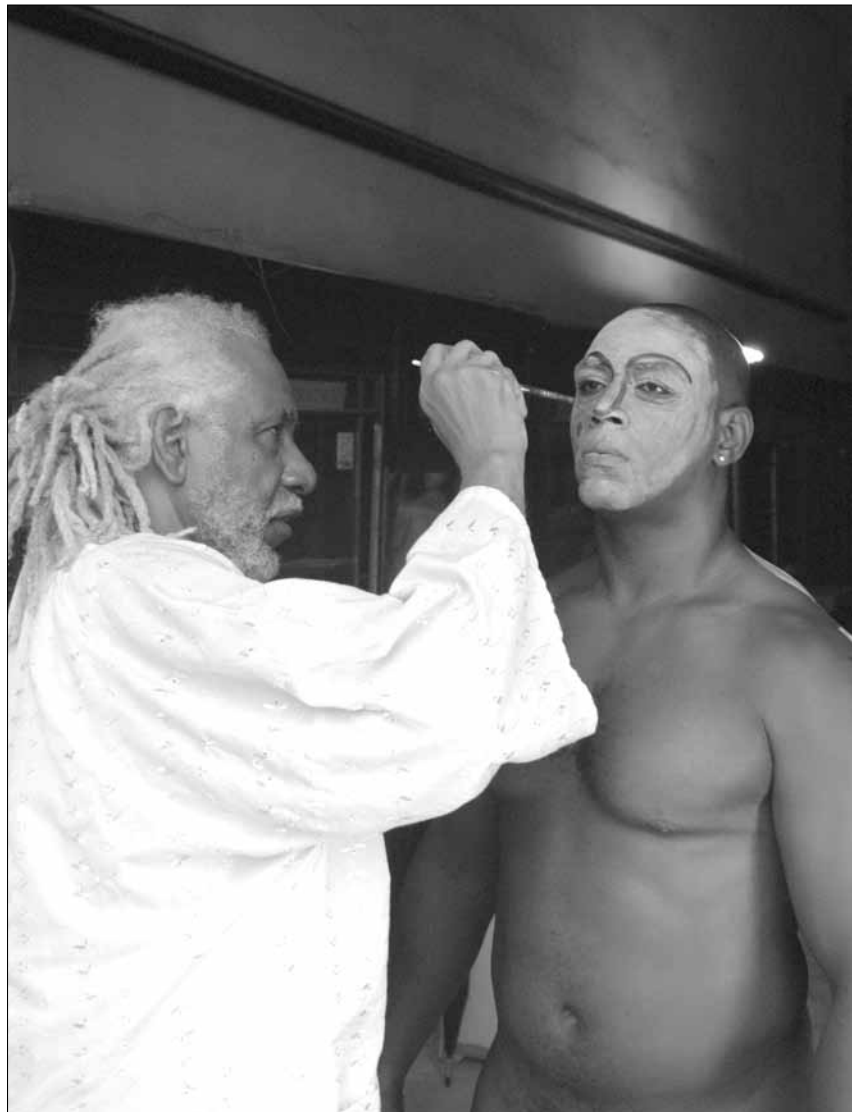
Artista pintando un cuerpo para una performance.

Paulo, y Venecia. Sus obras se encuentran en importantes colecciones privadas y públicas en Cuba y en el extranjero, entre ellas: Museo Nacional de Bellas Artes de la Habana, Cuba; Centro Nacional de Arte y Cultura Georges Pompidou, París, Francia; Museo de Arte Moderno de Panamá; Museo de Arte Moderno de Cartagena de Indias, Colombia; Centro Atlántico de Arte Moderno, Las Palmas de Gran Canaria, Fundación Sa Nostra, Palma de Mallorca; Museo Nacional de Tanzania; The John F. Kennedy Center, Washington DC, E.U; Grupo SEIBU, Tokio, Japón; Centro Cultural de Manila, Filipinas; Frost Museum, Miami. Sus piezas han sido presentadas en subastas de arte reconocidas internacionalmente como Subasta Habana, Sotheby's Latin American Art y Christie's Latin American Art, Nueva York.