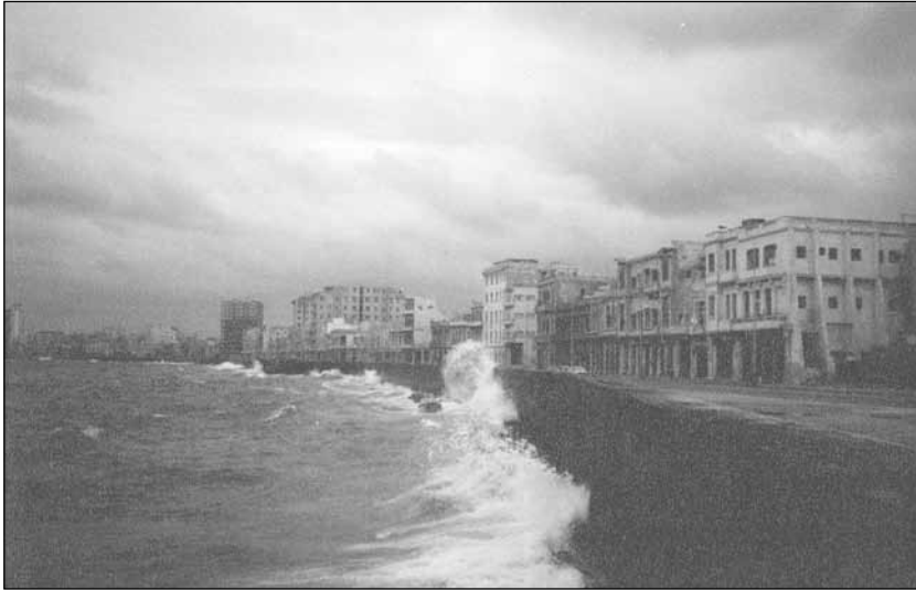
Malecón Habanero.

el sexismo, el machismo, entre otros; desde el punto de vista colectivo, hay organizaciones e instituciones que efectúan encuentros, presentaciones de libros, que cuando tienen relación con la temática racial siempre se obtienen resultados muy positivos como bien puede ilustrarse con las actividades mensuales que realiza la Cofradía de la Negritud desde la Casa Comunitaria de la Ceiba, acción que se ha convertido en un taller que persigue la socialización del conocimiento sobre la problemática racial en nuestro país, y la conscientización e identificación plena de los que asisten con las temáticas que allí se abordan.