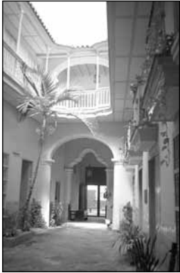
Fundación Alejo Carpentier. La Habana.