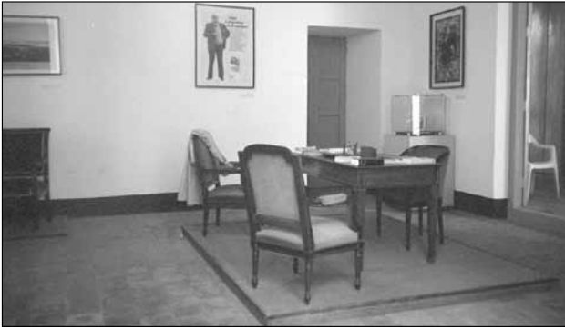
Mobiliario del despacho de Alejo Carpentier en la Embajada de Cuba en París. La Habana.

jo la yesosa y pobre apariencia, ocultaban en las honduras una iluminación del palacio engualdado. (...) En ese prodigioso Mar de las Islas, hasta los guijarros del Océano tenían estilo y duende; los había tan perfectamente redondos que parecían pulidos en