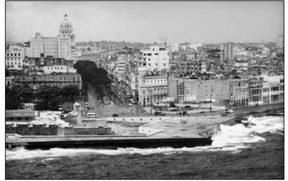
El Prado desde el Morro. La Habana, Cuba.