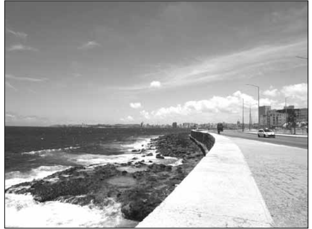
EL Malecón. La Habana, Cuba.

Eran vivas pencas de madréporas, la poma moteada y cantarina de las porcelanas, la esbeltez catedralicia de ciertos caracoles que, por sus piñones y agujas, sólo podían verse como creaciones góticas; el encrespamiento rocalloso de los abrojines, la pitagórica espiral del huso —el fingimiento de muchas conchas que, ba-