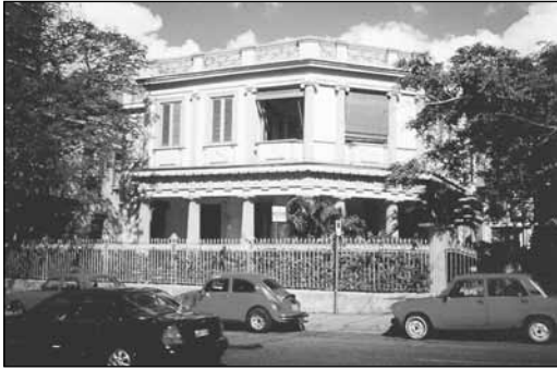
Fundación Fernando Ortiz. La Habana, Cuba.