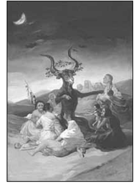
El Aquelarre, Francisco de Goya.

Esta atmósfera de pesadillas es la que aparece en ambos textos, y al comparar el «triple velorio» con estas escenas del siglo XVII español, Betancourt estaba condenando no solo su vida criminal, sino también sus creencias religiosas y sus prácticas «relajadas». Implícitamente además, estaba haciendo lo que la Santa Inquisición en Logroño. En Cuba existe al menos un precedente de estos autos inquisitoriales en el suceso que recogió el obispo de la Habana, Pedro Agustín Morel de Santa Cruz en Historia de la isla y catedral de Cuba , y luego reprodujo Fernando Ortiz en Una pelea cubana contra los demonios . Me refiero al Acta notarial de las declaraciones y juramento de Lucifer, ocurrido el 4 de septiembre de 1682 en la Villa de Santa Clara. Según