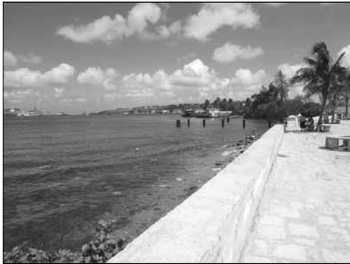
Regla. Paseo junto al mar.