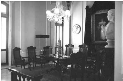
Salón del Palacio de los Capitanes Generales. La Habana, Cuba.