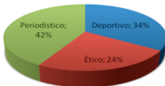
Gráfico 1. Análisis de contenido: presencia de campos semánticos